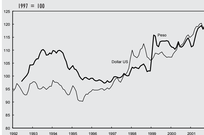
GRAPHIQUE 2 : TAUX DE CHANGE EFFECTIF RÉEL DU PESO ET DU DOLLAR US