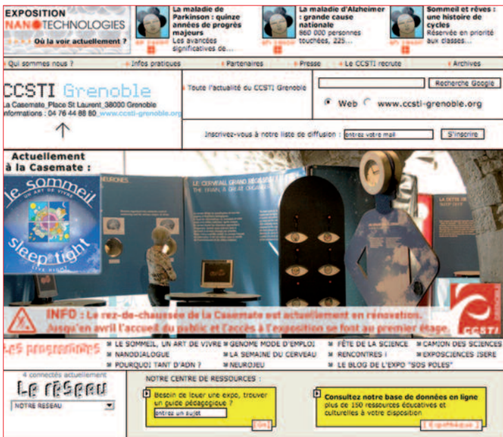
Le CCSTI de Grenoble : un site qui montre la diversité des fonctions d'un CCSTI

L'étude présentée ici – menée à partir d'une sélection de sites Internet les plus représentatifs de la culture scientifique, technique et industrielle – a consisté en une analyse concomitante des pratiques (les usages des internautes) et de l'offre (les stratégies éditoriales des sites) et a permis de définir des stratégies possibles pour la mise en place d'une politique de CSTI sur le Web 2.0.