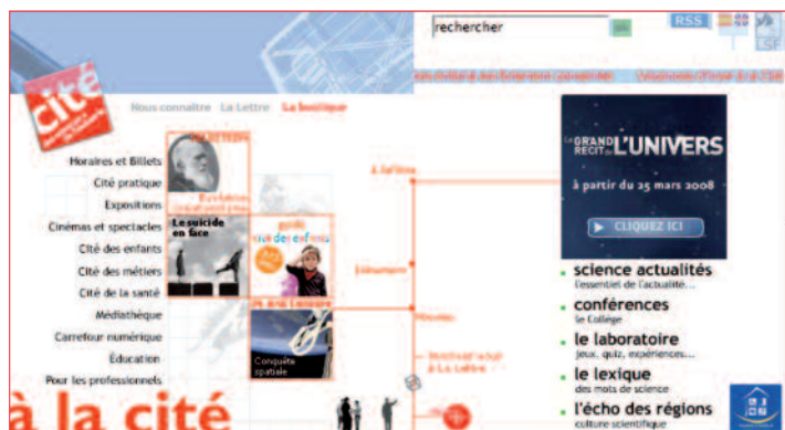
La Cité des Sciences et de l'Industrie : un site portail

Pour analyser ces résultats et comprendre leur caractère non prévisible, il a été nécessaire de décrire les propriétés sémantiques des sites et de l'offre de liens notamment. Il apparaît ainsi que les sites portails