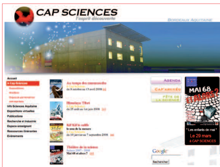
Cap Sciences : un site agrégat

Les saillances ont la capacité d'attirer l'attention (dans ses deux valeurs : intensité + durée) et l'analyse des sites Web doit permettre de rendre compte de cette capacité d'attraction de l'attention. Mais elle est toujours dépendante du contexte et ne peut être ramenée à des règles de genres définies a priori ou à des recettes comme le font croire beaucoup de manuels du type « how to ». C'est pourquoi, il a été indispensable de faire appel à des jurys qui vont collectivement produire leur évaluation de ce qui attire leur attention et pour identifier les types de saillances dominantes. À ce moment, nous pouvons mieux comprendre comment les sites Web sont toujours des compositions entre plusieurs traditions.