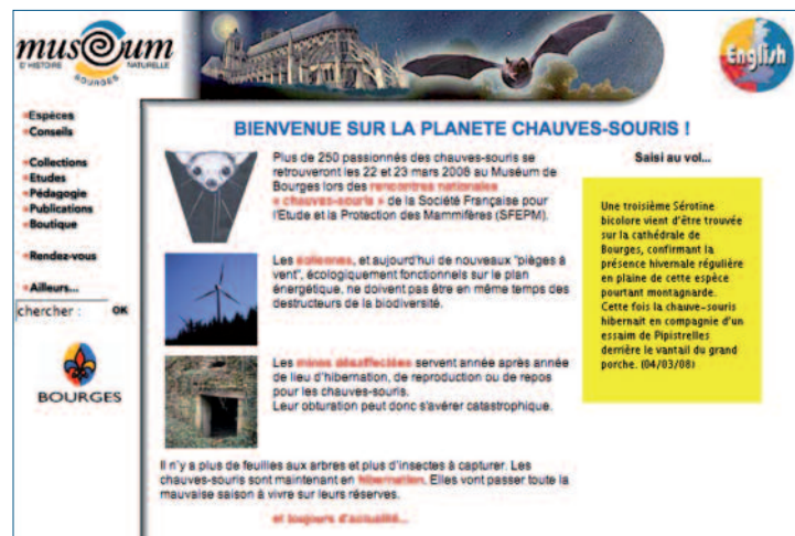
Le muséum de Bourges : un site qui propose une recherche aisée des informations

Cependant, ces enjeux prennent une autre visibilité à travers l'étude des sites Web et permettent de