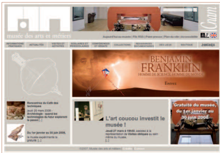
Le musée des Arts et Métiers : un CD-ROM culturel au format écran

Les outils dont le groupe RTGI dispose pour réaliser cette étude sont de deux types : les outils d'extraction et d'indexation des données issues du Web, et les outils de traitement et d'analyse de ces données. Nous utilisons de petits robots semblables à ceux des moteurs de recherche pour parcourir le Web automatiquement. Ces robots logiciels, appelés « crawlers », rapatrient les données disponibles sur le Web dans une base de données. Classiquement, les crawlers parcourent les pages de lien en lien à partir d'un ensemble de pages données appelées « points d'entrée » et jusqu'à un nombre de liens hypertextes fixé à l'avance, appelé « profondeur ». L'étape de rapatriement des données, appelée « crawl », s'arrête lorsque toutes les pages ont été visitées jusqu'à la profondeur paramétrée. Toutefois, dans notre cas le fonctionnement des robots est sensiblement différent. En effet, nous nous intéressons aux sites et non aux pages. Par conséquent, les robots sont paramétrés de telle sorte qu'ils parcourent les sites à partir de leur page d'accueil, jusqu'à une profondeur en pages fixée, en