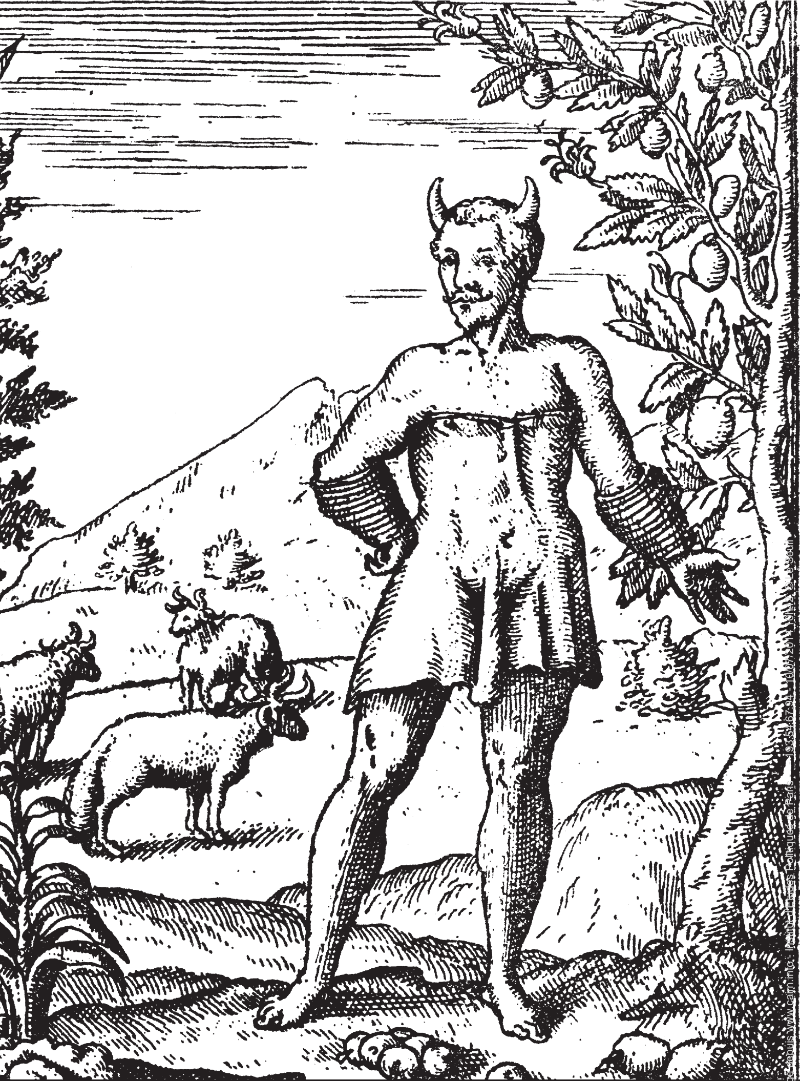
du récit de la «Première navigation» de Cornelis de Houtman en direction des Indes Orientales (1595-1596).