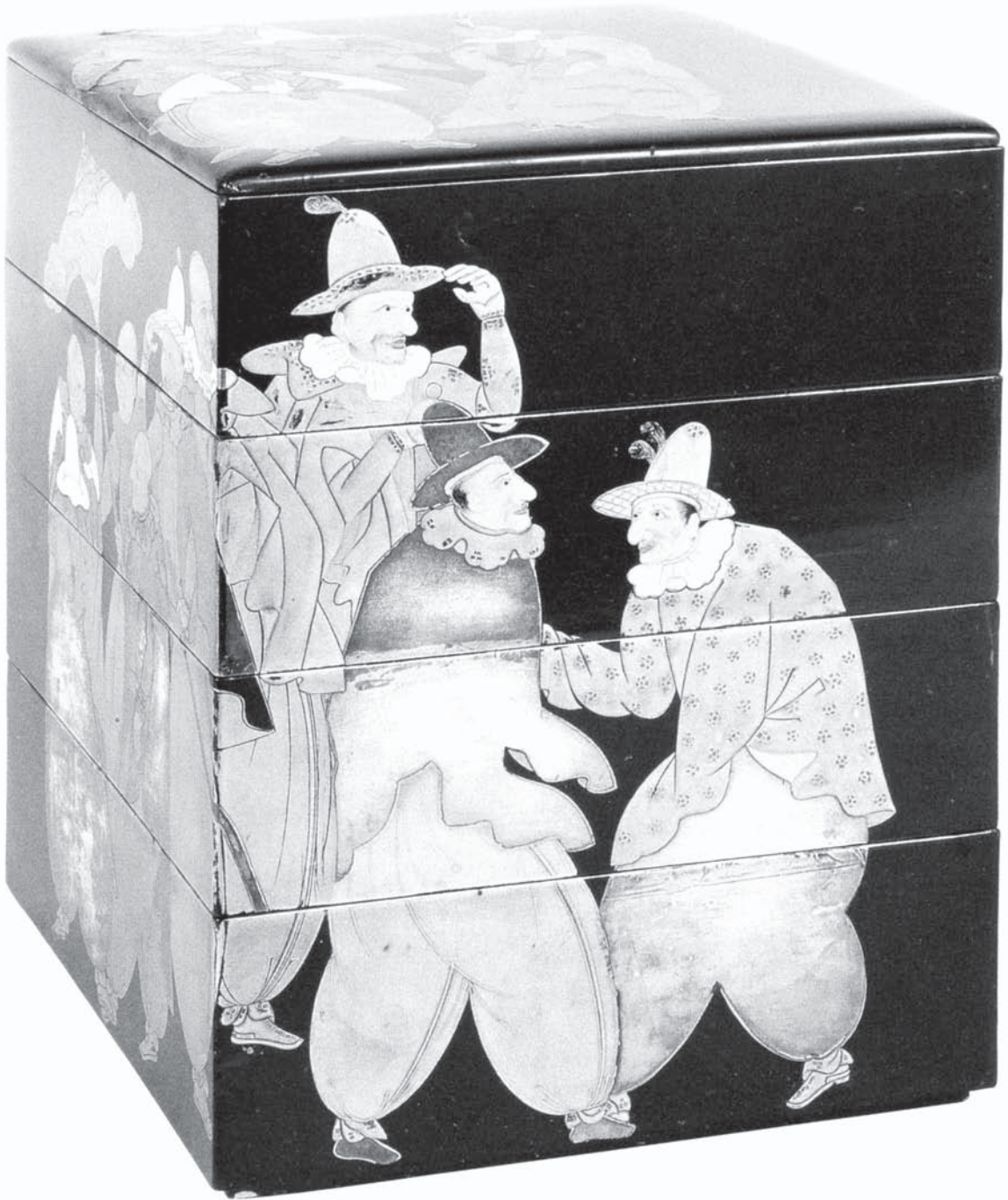
LES COLONISATEURS VUS DU SUD. Boîte garde-manger à étages en laque noire, décor en laque or takamakie et incrustations de feuilles d'or et d'argent, Japon, 1600-1625. Les Portugais y sont représentés avec leurs traits qui leur sont communément attribués : grands nez, chapeaux, fraises et pantalons bouffants.