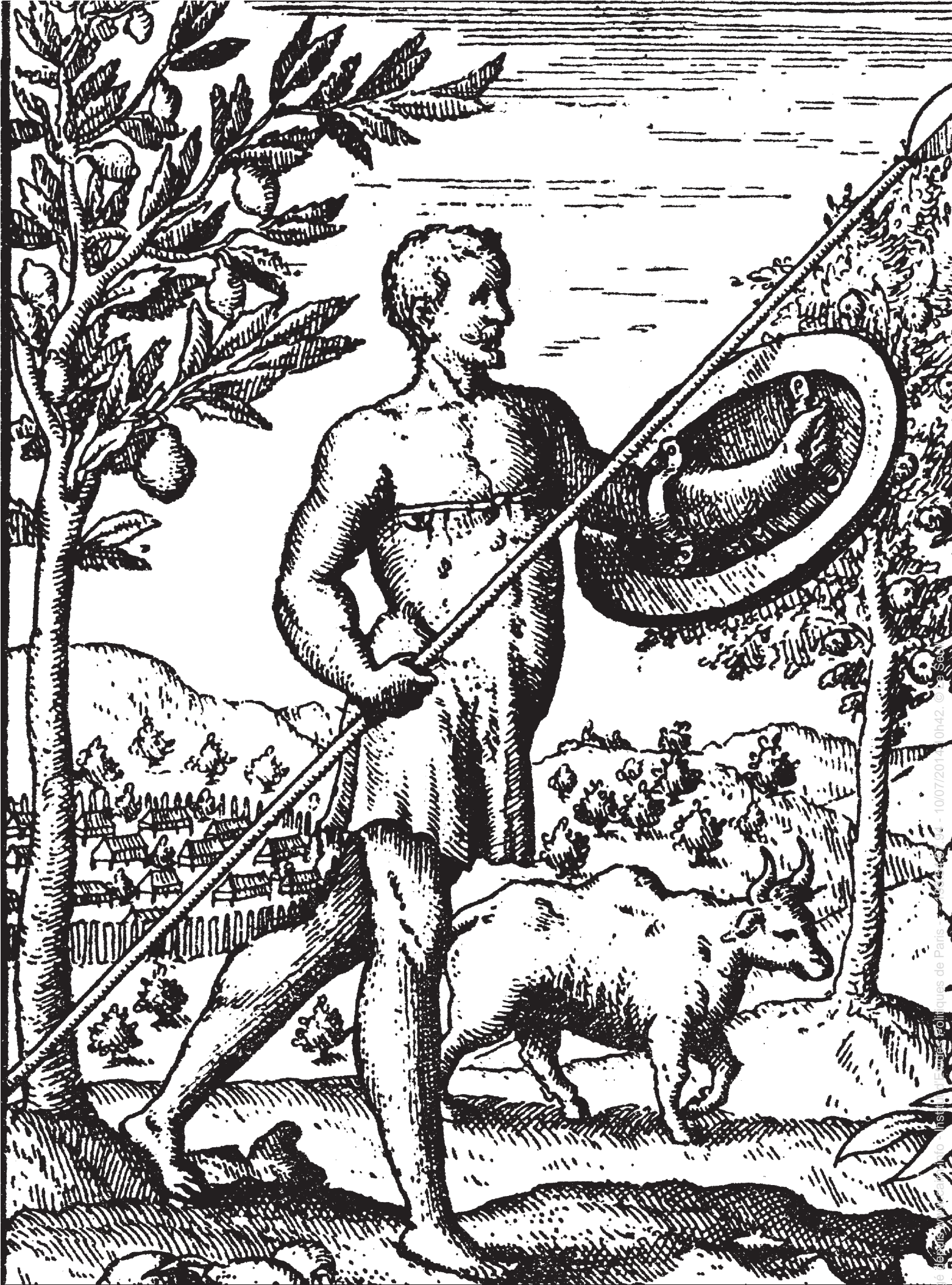
UN HOMME À CORNES DE LA BAIE D'ANTONGIL (côte orientale de Madagascar). Gravure extraite de l'ouvrage de M. de la Sonnerie, Voyage aux Indes Orientales, tome 1, page 104.