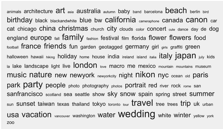
Figure 12 : Nuage de tags général de Flickr

visuelle produisent certes de la hiérarchie comme pour le tableau mais ne sont pas graphiquement mises en forme en vue de cadrer la circulation avec les autres catégories. La mise en liste est toujours un programme de lecture qui prétend faire respecter la linéarité. La taille des tags est aussi un programme de lecture mais plus ouvert puisque plusieurs tags peuvent avoir la même taille et qu'il faut se déplacer dans l'espace du nuage sans ordre pré arrangé.