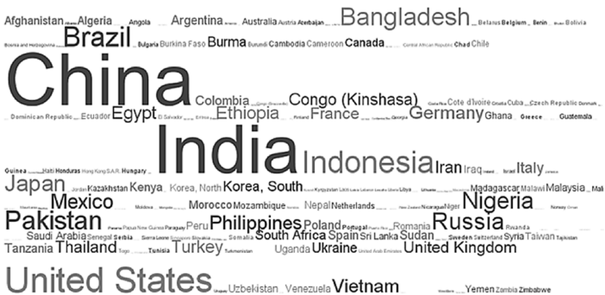
Figure 8 : nuage de tags statistique de population