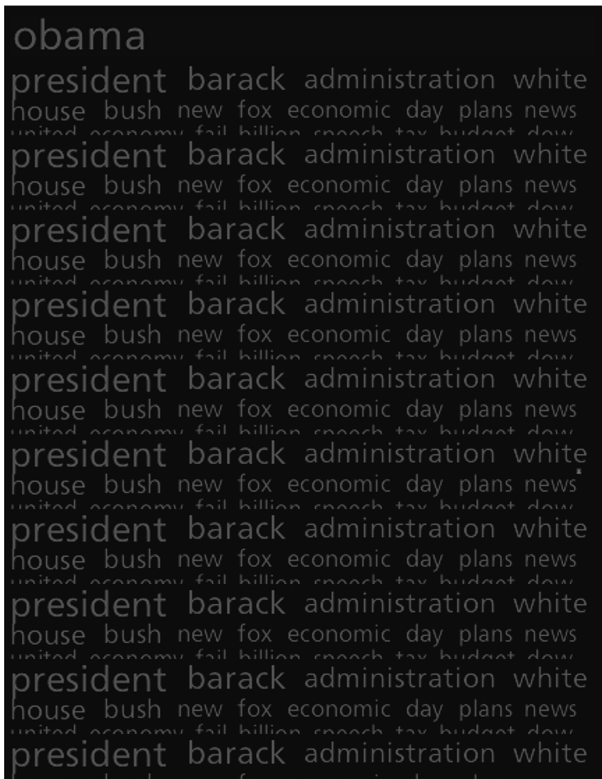
Figure 1 : Digtrends analyse lexicale