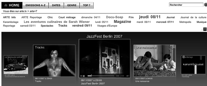
Figure 10 : Nuage de tags des catégories sur Arte

La présence d'un terme dans le nuage est motivée par un calcul, celui de la fréquence d'apparition de ce tag (sans que l'on sache d'ailleurs souvent quel est le domaine de référence pour calculer cette popularité), les moins fréquents n'apparaissent même pas, les plus fréquents apparaissant en plus gros : il s'agit donc d'une représentation d'une forme de doxa locale, fondée sur une statistique de fréquence. Ce ne sont donc pas des opérations délibérées de présentation mais une automatisation qui est supposée faire l'intérêt de ces présentations. La hiérarchie n'est donc ni logique ni politique (ou auctoriale, au sens d'une autorité ou d'un auteur qui déciderait ce qui doit apparaître en premier), elle est purement calculatoire et fréquentative. En réalité, le standard de présentation faisant effet de mode, certains l'utilisent pour présenter toutes sortes de listes de façon plus connotée web 2.0 alors qu'ils ont eux-mêmes positionnés les tags qui sont parfois seulement des catégories thématiques produites par les éditeurs des sites et présentées sous forme de nuage (figure 10).