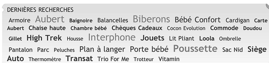
Figure 2 : Aubert requêtes des utilisateurs