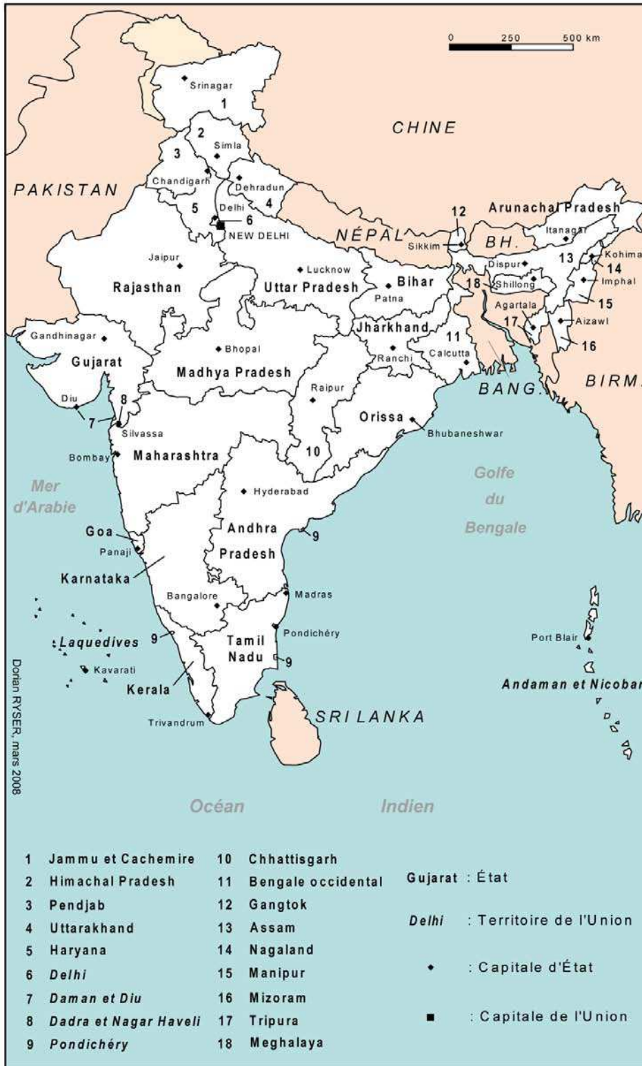
Carte 1 L'Inde politique