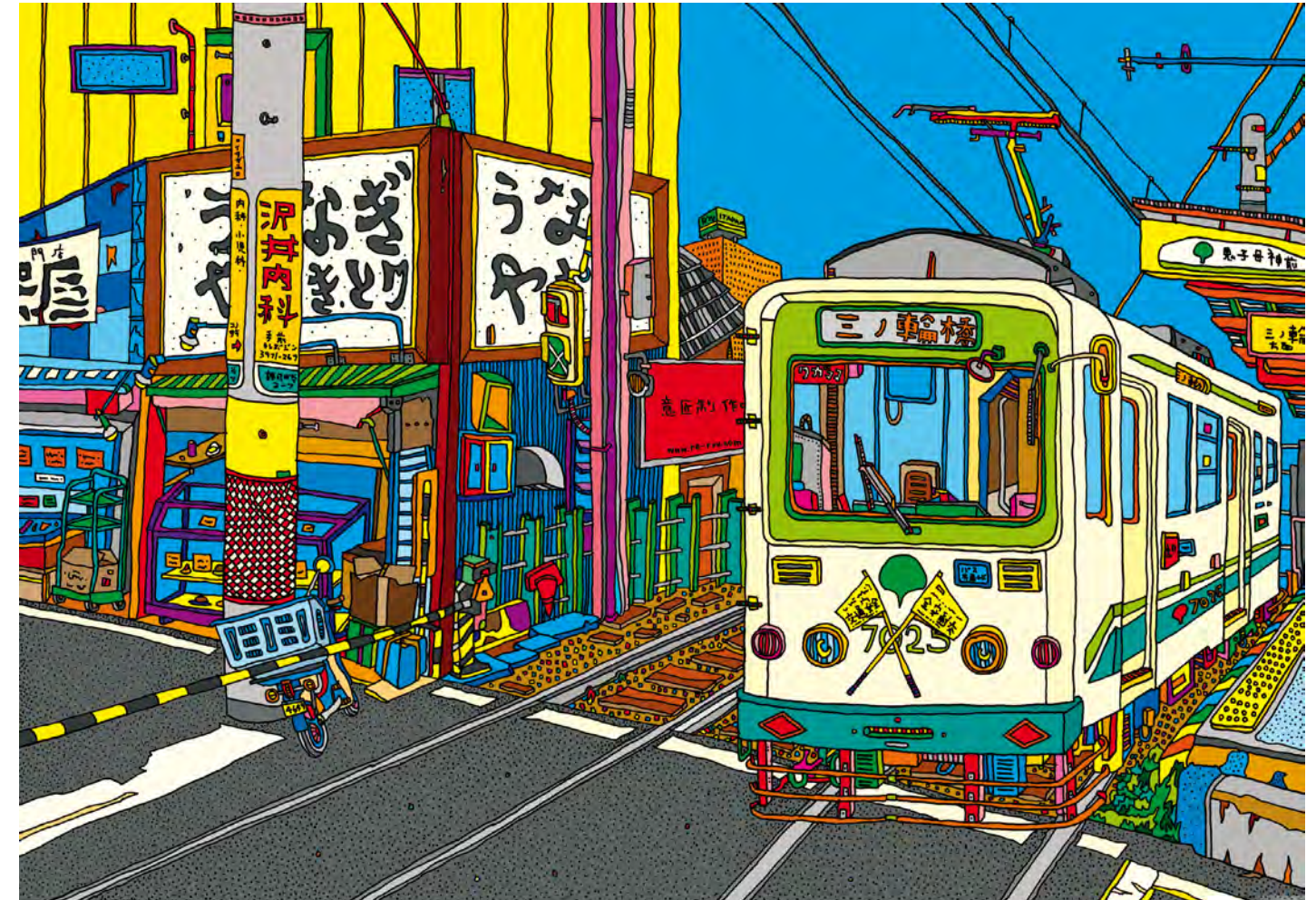
ITADANI RYU To-Den , 2005 Inkjet print on paper, 29.51 x 42.2cm