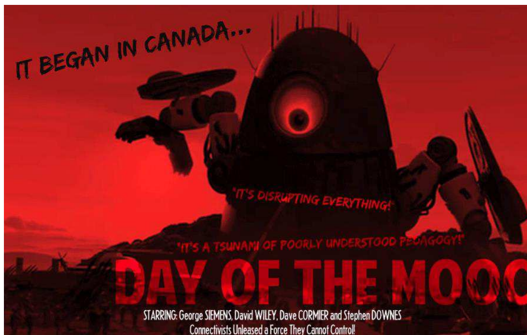
Image : Day of the Mooc.

Mais la bulle qui s'est ainsi créée a contaminé d'autres universités comme le MIT et Harvard qui ont entraîné UC Berkeley, University of Texas, Georgetown et Wellesley pour créer EdX , alors pourtant que le MIT avait déjà son OpenCourseWare disponible . Mais ces deux institutions, plus avisées, ont créé une plate-forme (de seulement 24 cours pour l'instant) qui veut avant tout tester de nouvelles méthodes pédagogiques adaptées à ces contextes en ligne, en limitant même parfois les inscriptions dans certains cours, comme celui sur le Copyright. De plus, leur modèle économique est non-profit, non dépendant de capitaux risqueurs et leur technologie en Open Source. Bref, une autre philosophie, mais pourtant une réponse quasi contrainte à l'offensive d'une marque, Stanford. Et Open University vient aussi de lancer le Mooc britannique ( FutureLearn ) qui démarrera en 2013 et a réussi à entraîner plusieurs universités européennes. Pourtant Open University possédait un modèle performant d'enseignement à distance et une véritable expertise dans ce domaine. Mais tout se passe comme s'il fallait tout relooker à la mode des Mooc. L'offre promet d'être tellement abondante qu'un moteur de recherche/site de recommandations 2.0, CourseTalk , permet de s'orienter et d'évaluer l'offre.