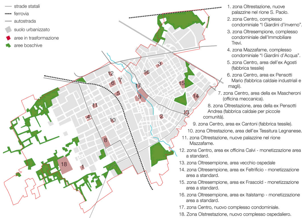
Figure n° 2: Les grandes mutations urbaines de Legnano de 2005 à 2010.

Source : D. Pennati (2011), relevé photographique par satellite, 2009.