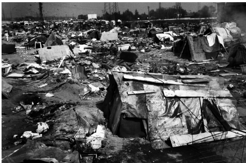
Fig. 2 – Baraccopoli. A due ore dal passaggio delle ruspe dallo sgombero al campo abusivo di via Barzaghi, in cui le ruspe hanno distrutto ogni cosa (compresi documenti, vestiti, strumenti musicali).