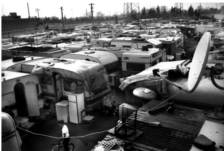
Fig. 3 – Campo attrezzato di via Triboniano, Milano, 2002. Definito dal comune "campo attrezzato", il nuovo campo di via Triboniano, nato dalle ceneri di via Barzaghi, non ha luce né gas (e i bagni, senza le docce, sono inagibili). Dopo soli due mesi dalla sua apertura il numero degli abitanti era già triplicato.