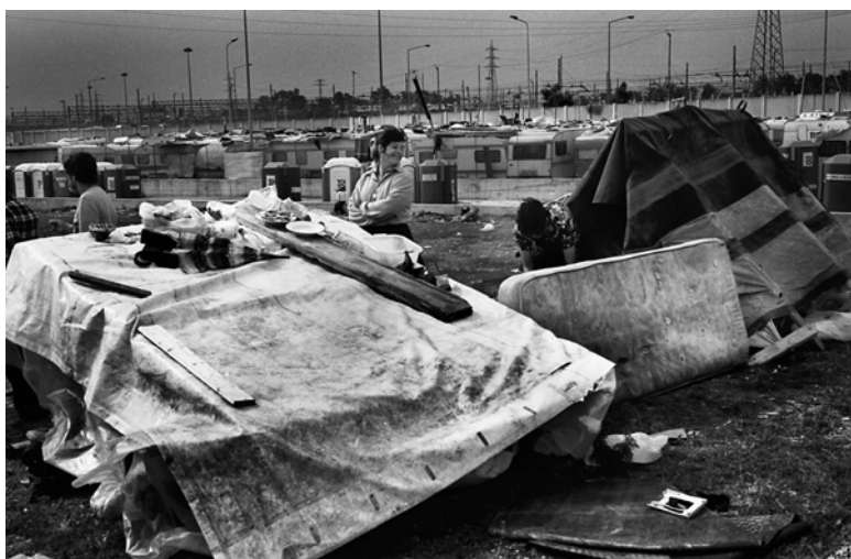
Fig. 4 – Tendopoli, Milano 2003. Il campo autorizzato di via Triboniano non riesce a contenere il numero sempre crescente dei rom che si affollano con tende e baracche nello spazio antistante le roulotte.