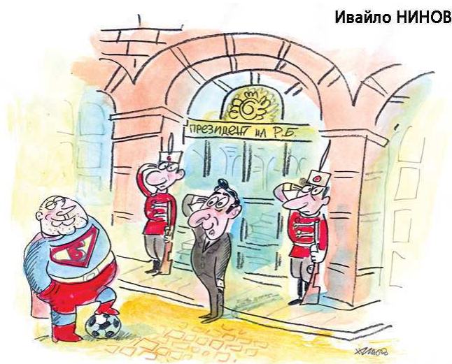
Illustration 1 : La relation entre le nouveau président (au centre) et le Premier ministre (à gauche) figurée dans l'hebdomadaire satirique, Stǎršel