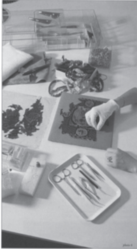
PHOTOGRAPHIE I. – Le traitement d'un tissu copte présenté par une restauratrice diplômée (32)

La Photographie I montre de façon éloquent que les restaurateurs diplômés mobilisent aussi l'analogie avec la chirurgie lorsqu'ils présentent leur travail au public et à leurs pairs – ici dans une revue destinée aux professionnels des musées. Loin du mystère qui caractérise généralement les représentations du métier de restaurateur, une telle présentation des outils et de l'activité lui confère le caractère aseptisé et rationnel de la chirurgie – du reste, des restauratrices diplômées interviewées reconnaissent qu'il est bien difficile de porter des gants quand on manipule du fil ou des aiguilles ! Sous prétexte de rendre plus compréhensible le travail des « conservateurs-restaurateurs », l'analogie rapproche un groupe professionnel en mal de définition