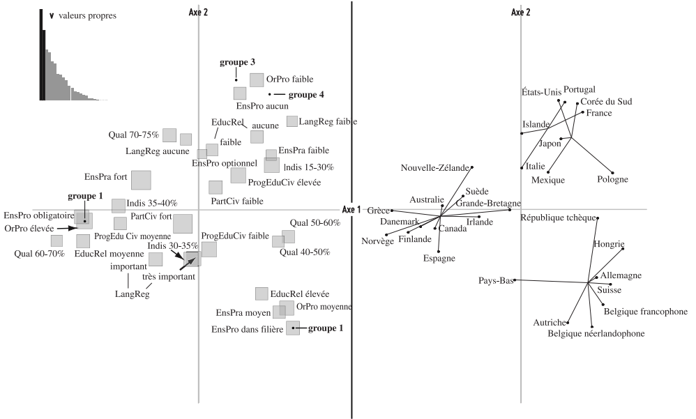
GRAPHIQUE II. – Analyse factorielle des correspondances des variables de contenus

Note : Nuages des modalités et des pays dans le plan axe 1 – axe 2. La surface des carrés est proportionnelle à l'effectif de la modalité. La typologie est une variable supplémentaire.