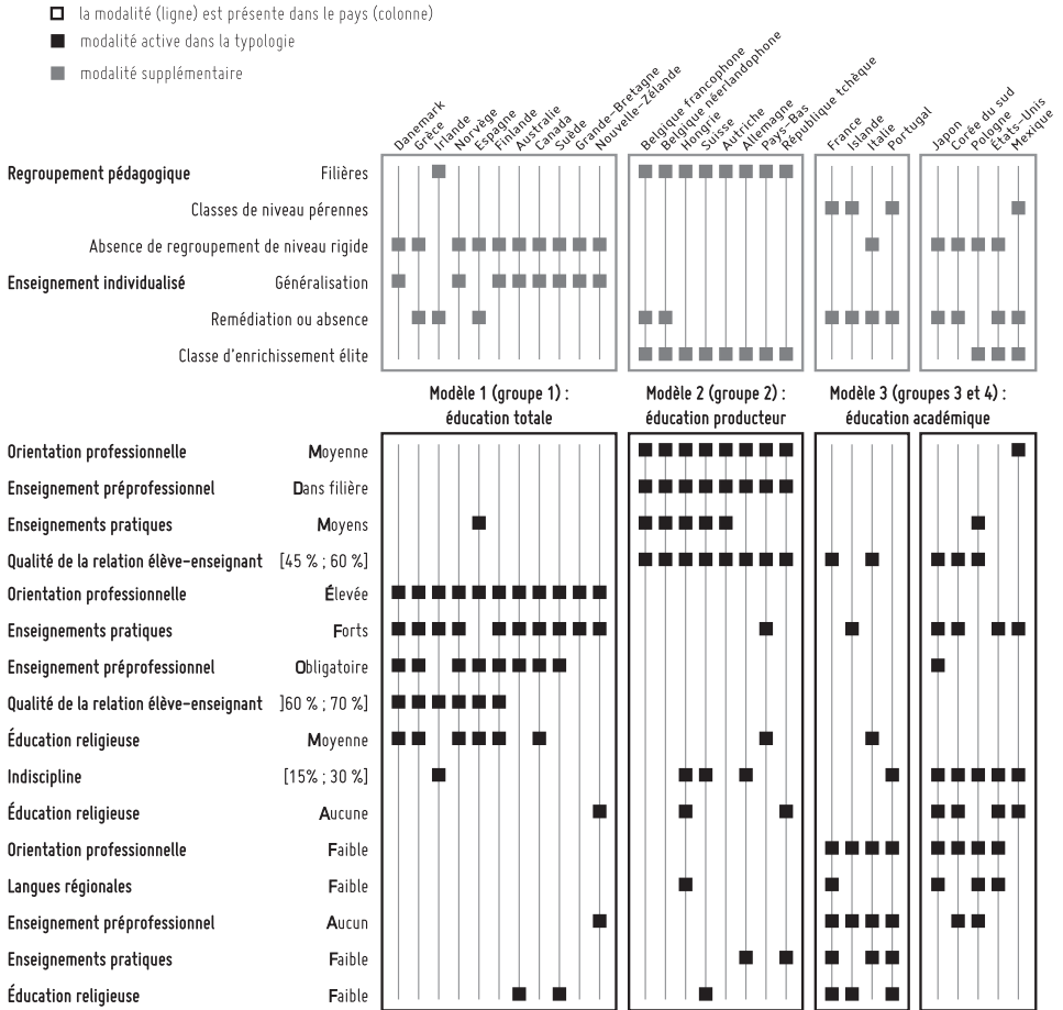
TABLEAU I. – Groupes de pays et modalités les caractérisant

certaines modalités ont été écartées (7), et les modalités restantes ont été ordonnées afin de faire apparaître les combinaisons de modalités propres à chaque groupe. De plus, nous avons rajouté deux variables, issues de travaux précédents (Mons, 2004) portant sur l'enseignement individualisé et les modalités des regroupements pédagogiques des élèves. Il apparaît que les quatre groupes de pays se différencient aussi du point de vue des modalités de regroupement et de suivi pédagogiques des élèves.