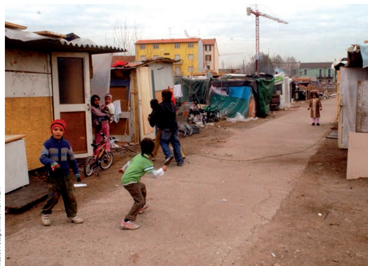
Milano / Fotogramma / RCP/REA

Les problèmes liés aux camps et aux baraquements roms existent de longue date et ne constituent pas un phénomène purement italien ; ils sont néanmoins constants et pérennes, et donnent le pouls des multiples tensions urbaines /10. Au cours des dix dernières années, et d'une façon exacerbée lors