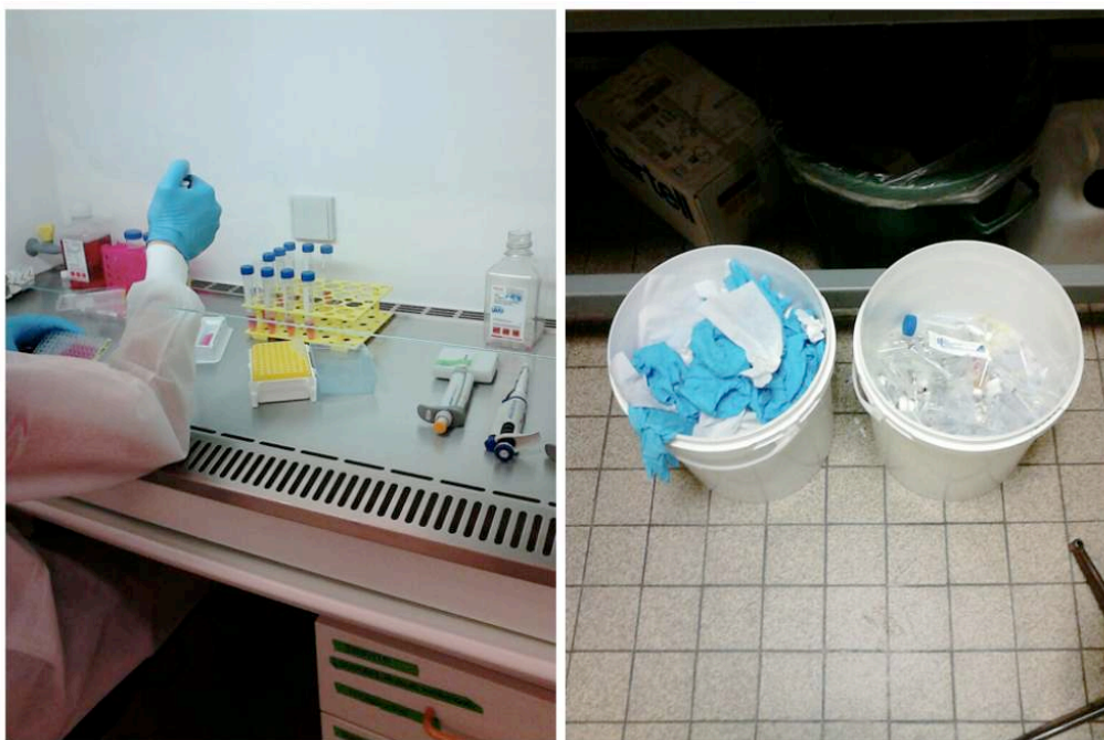
Figure 1. Des paillasses aux poubelles, un monde bien ordonné