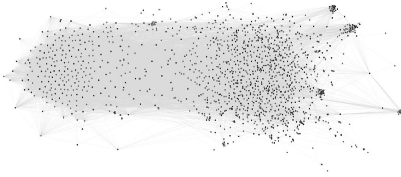
Figure 1. Le réseau biparti des expressions (en gris foncé) et des documents (en gris clair)

Le réseau de la Figure 1, ainsi que les réseaux suivants, sont spatialisés à l'aide d'un algorithme force-vecteur (en l'occurrence ForceAtlas2 LinLog mode 35 ). Cette étape est très importante : elle consiste à positionner les nœuds du graphe en utilisant un algorithme qui simule un système de forces physiques. Dans ce système, les nœuds exercent une force de répulsion les uns sur les autres, tandis que les arcs fonctionnent comme des élastiques, gardant proches les nœuds qu'ils connectent. Une fois que l'algorithme trouve sa position d'équilibre, la position relative des nœuds devient significative. Si, par exemple, deux documents se retrouvent proches dans le graphe, c'est parce qu'ils partagent plusieurs expressions. Ou encore, si une expression est liée à deux documents seulement, elle va occuper une position intermédiaire entre les deux.