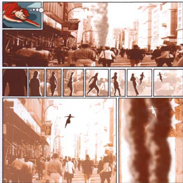
Fig. 1: Revel, Sandrine, 2002, Le 11 e jour .