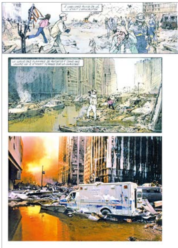
Fig. 3 : Gi Kim Jung, Morvan Jean-David, Tréfeuël Séverine, McCurry, NY 11 septembre 2001 , 2016, p. 75.

quants comme le récépissé de déclaration de plainte de Fred Dewilde, pour « assassinat, tentative d'assassinat en relation avec une entreprise terroriste » (Dewilde, p. 30). Le dessin tient une place essentielle dans ces récits. Il s'oppose à la longueur de certains discours, révèle même jusqu'au paroxysme des sentiments que l'auteur n'arrive pas à exprimer. Toutes ses caractéristiques y font sens ; l'emploi des couleurs ; la présence ou l'absence de cases, de forme et de taille variable ; le trait, lequel est modulable tant dans le dessin lui-même que dans la graphie des écritures.