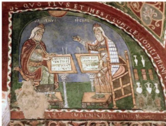
Galien et Hippocrate, peinture murale du XIIe siècle, Anagni (Italie). Cette image illustre à la fois la continuité de la pensée médicale et la notion d'évolution entre ces deux médecins grecs, séparés de six siècles. Galien se démarque d'Hippocrate notamment par l'idée que chaque organe du corps a une fonction spécifique.

Dans son ensemble, avec le soutien de l'État et en concurrence avec d'autres groupes tels que les guérisseurs spirituels, la profession médicale a obtenu au xxe siècle le monopole de la prestation de soins. Pour y parvenir, elle s'est appuyée sur un système cohérent et scientifique visant à définir, classer et diagnostiquer les phénomènes de mal-être somatique et/ou psychique). Mais c'est aussi sa capacité à s'auto-organiser (en disciplines, sociétés savantes, syndicats ... ) qui a conféré à la médecine son autorité en matière de santé.