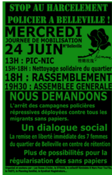
Flyer des Roses d'Acier pour annoncer le balayage collectif du 24 juin 2015