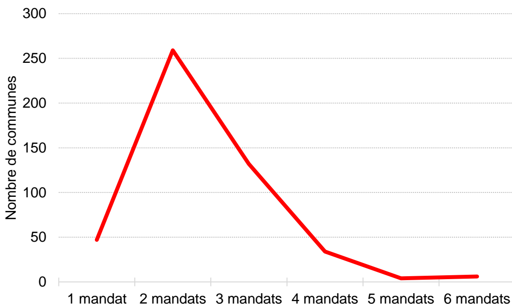
Graphique 2 : Distribution du nombre de mandats

Si l'on classe les communes en trois sous-groupes, correspondant chacun à un barème différent pour l'indemnisation maximale du maire, on observe que le nombre moyen de mandats reste inchangé et que l'écart sur l'indemnisation totale se fait entre les communes les moins grandes (entre 20 000 et 49 999 habitants) et les plus grandes (50 000 et plus) mais pas de manière linéaire et sur une amplitude de l'ordre de 10 000 € nets.