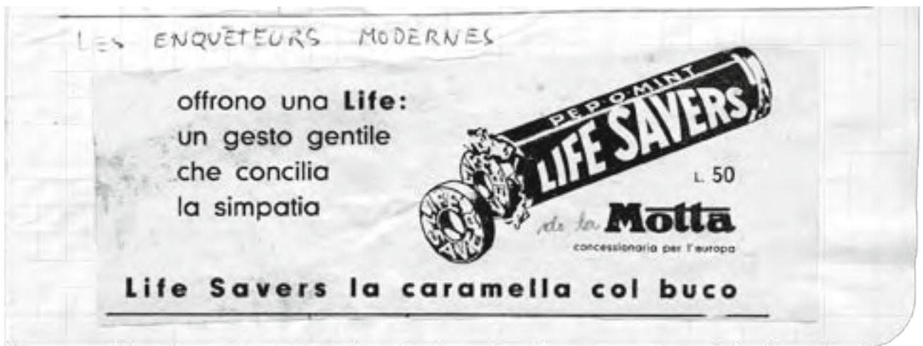
TROIS EXTRAITS DU CAHIER DES GASTON présentant des détournements humoristiques de publicités découpées dans des journaux.