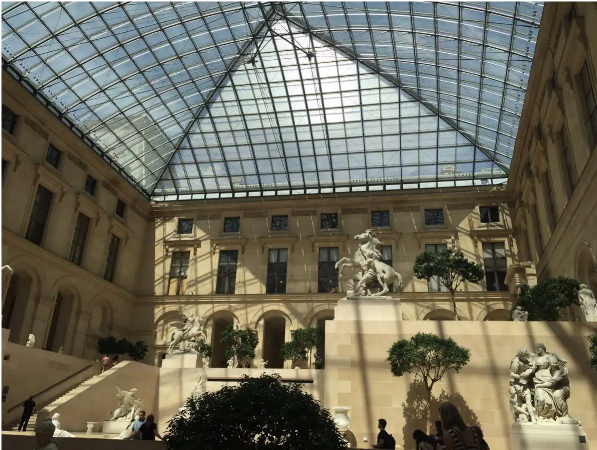
La cour Marly dans l'aile Richelieu du musée du Louvre.

De façon paradoxale, puisque c'est un musée du passé, visiter le Louvre, y déambuler, s'y perdre durant des heures (ce qu'on fait inévitablement, même si on n'en a pas le projet), c'est être un habitant de l'urbanité.