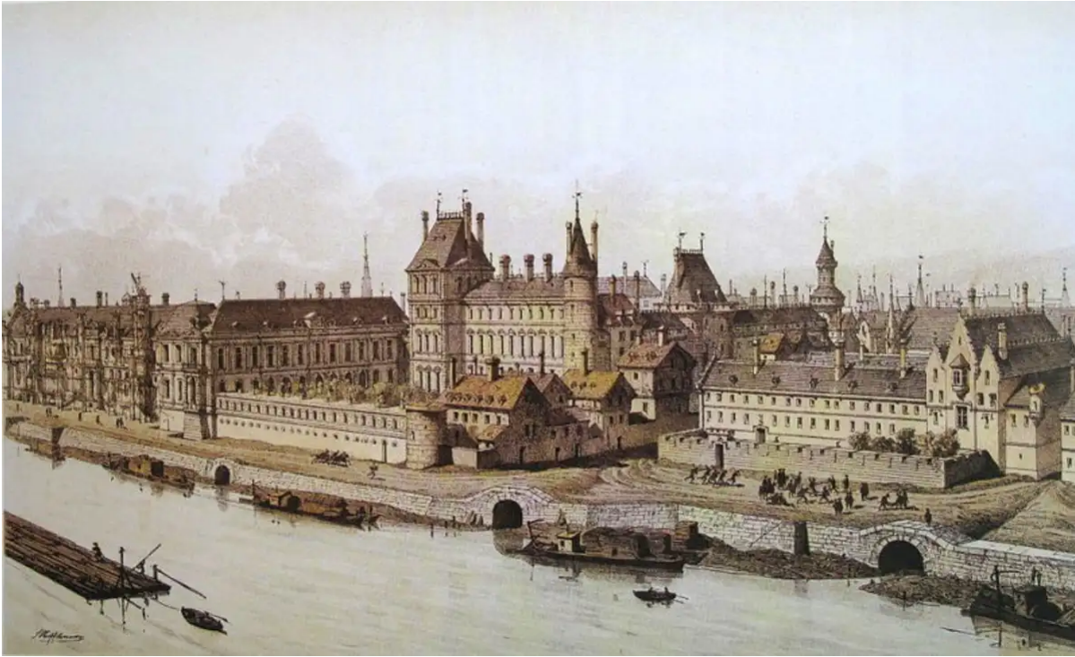
Le Louvre tel qu'il était sous Henri IV quand Louis XIII reprend le chantier.

Monsieur ». Une fois dans la place, La Mole s'étonne : « On va et on vient dans ce palais comme sur une place publique ». (chapitre 5, Du Louvre en particulier et de la vertu en général ).