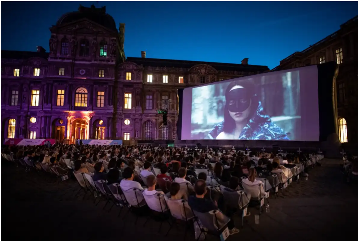
Le film La Reine Margot de Patrice Chéreau, projeté au Louvre en juillet 2019.

Rappelons brièvement en quoi le Louvre actuel est un haut lieu pour saisir comment le personnage du Louvre l'est dans La Reine Margot de Dumas. Le Louvre actuel est un haut lieu car, lieu parisien et français, il est devenu un emblème et une forme-sens de plusieurs valeurs qui font système : non seulement la culture et le patrimoine universels, mais aussi la ville mondiale et Paris qui en est une figure elle-même mondialement reconnue ; mais encore l'historicité et le passé monarchique de toute société ; ainsi que le politique, la tradition et la modernité. Au-delà même de ses collections, cet ensemble fait du Louvre le musée par excellence. C'est pourquoi la fréquentation du Louvre est très internationale. En dehors des Français ou des Parisiens nombreux sont les individus de tout autre lieu du monde qui peuvent s'identifier au Louvre.