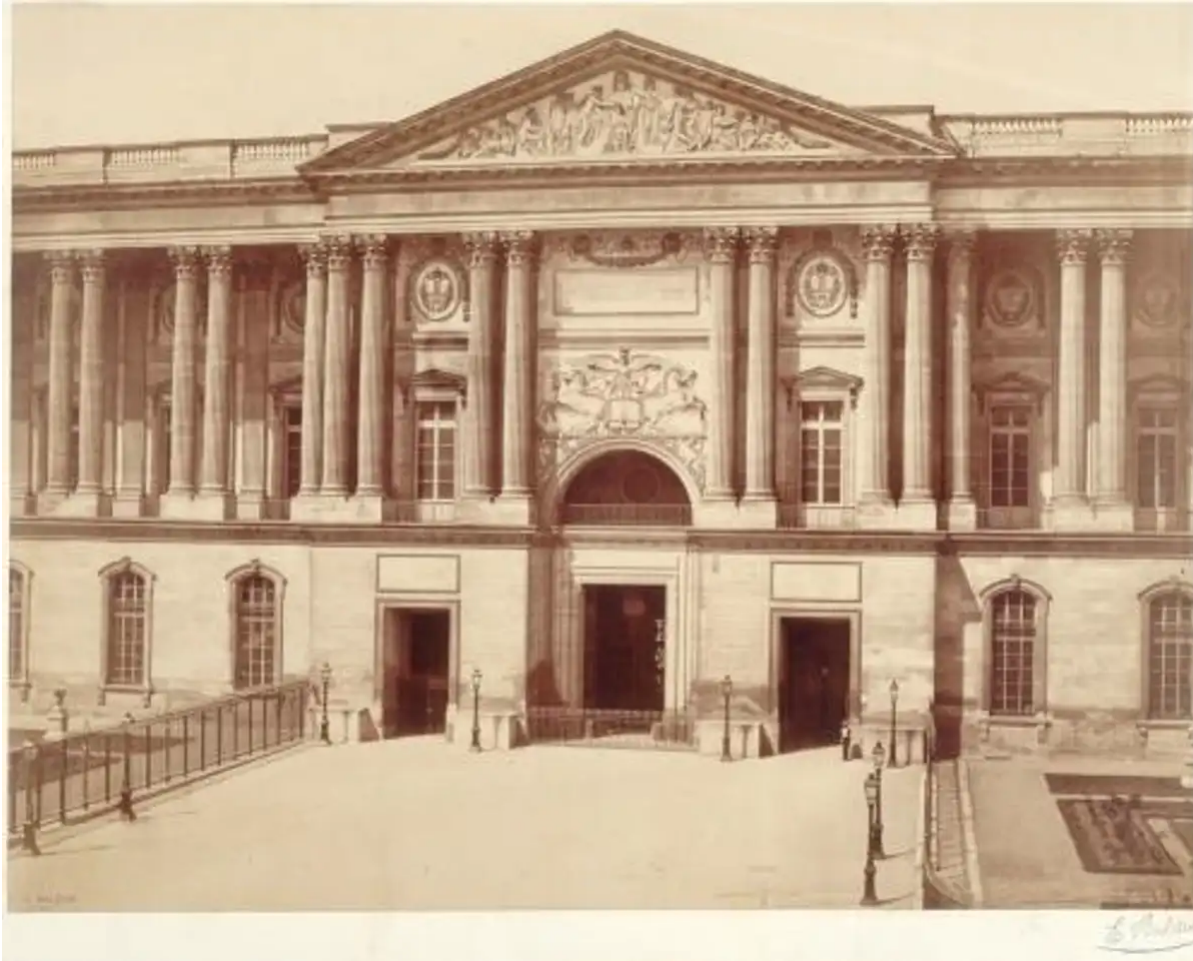
Façade de la colonnade de Perrault au Louvre. Photographie d'Edouard Baldus, entre 1852 et 1862. Musée Carnavalet. Site du musée Carnavalet

Dans La Reine Margot , les mots de passe qui soi-disant filtrent l'entrée au Louvre circulent avec une rapidité et une fluidité déconcertantes ; chaque parisien et chaque sujet du royaume de France parle du Louvre comme si ce palais était chez lui – le Louvre intimide, mais il est complètement familier. Le narrateur fait pénétrer à de multiples reprises le lecteur dans les corridors, les galeries, les salles, les multiples chambres du palais ; chaque chambre est elle-même la forme sens de l'intériorité comme du projet de société des principaux protagonistes : du roi Charles IX ; de la reine mère Catherine de Médicis ; de la reine Margot (Marguerite de Valois), leur sœur et fille ; de Henri de Navarre, époux de cette dernière et futur Henri IV ; du duc d'Alençon, frère cadet de Margot ; de La Mole.