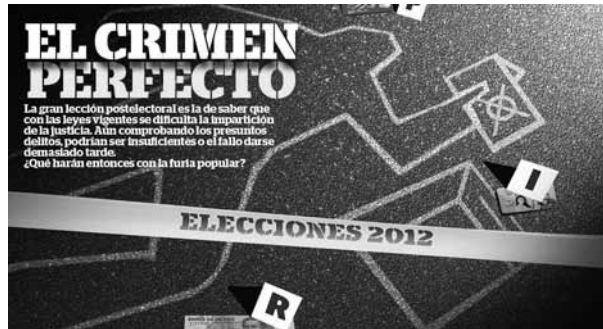
Image 16. Le crime parfait selon les opposants à Peña Nieto.