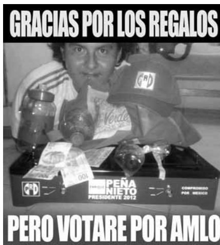
Image 13. « Merci pour tes cadeaux mais je voterai pour López Obrador ».

Images 11 et 12. L'image 11 montre des gadgets distribués durant la campagne de Peña Nieto parmi lesquels des objets d'une certaines valeurs comme les vélos (sont-ils distribué ou servent-ils aux militants du PRI pour le porte-à-porte ?). L'image 12 parodiant les largesses du PRI affirme « Profites-en ! Le PRI offre des gringas ! ».