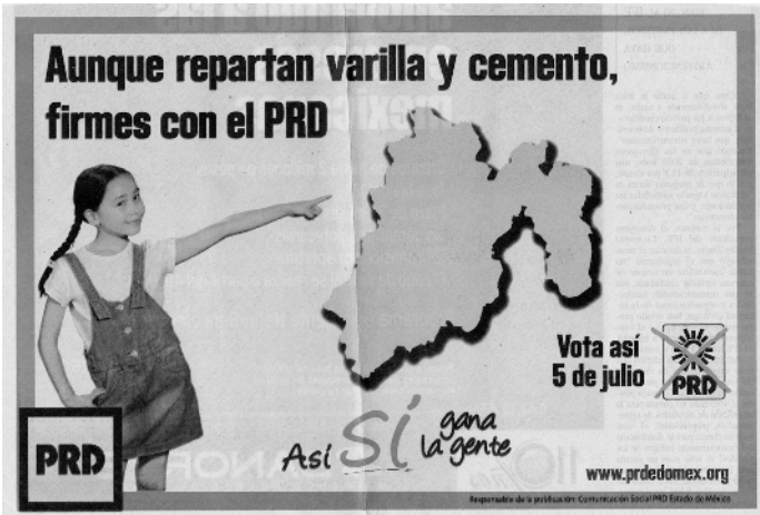
Image 6. Publicité du PRD diffusée dans la Jornada lors de l'élection du gouvernement de l'État de Mexico en 2009. On peut lire « Même si on distribue de la vaisselle et du ciment, signe pour le PRD ». Cette élection marque un tournant. La dénonciation de l'altération des suffrages ne se fait plus sous l'étiquette de luttes contre les fraudes (schéma dominant en 2006) mais celle de la lutte contre le clientélisme.