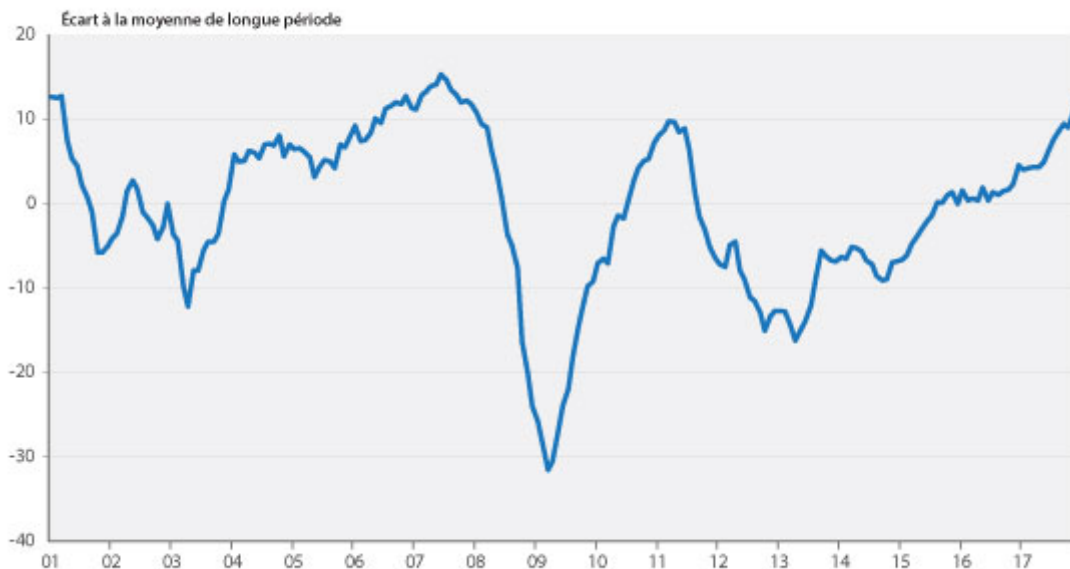
Graphique 1. Climat des affaires en France

La publication ce jour des indicateurs de confiance dans les différentes branches confirme l'optimisme des chefs d'entreprises interrogés par l'INSEE en décembre. Le climat général des affaires a rejoint son niveau de fin 2007, dépassant son pic de rebond de début 2011.