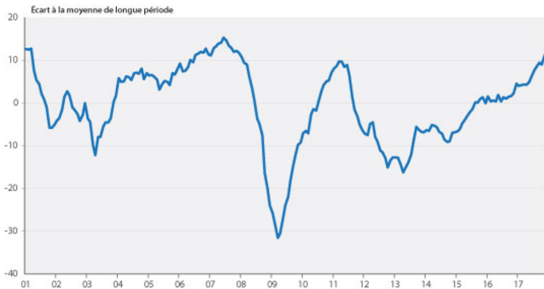
Graphique 1. Climat des affaires en France

La publication ce jour des indicateurs de confiance dans les différentes branches confirme l'optimisme des chefs d'entreprises interrogés par l'INSEE en décembre. Le climat général des affaires a rejoint son niveau de fin 2007, dépassant son pic de rebond de début 2011.