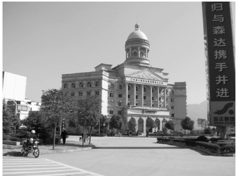
L'une des banques de la ville nouvelle de Zigui