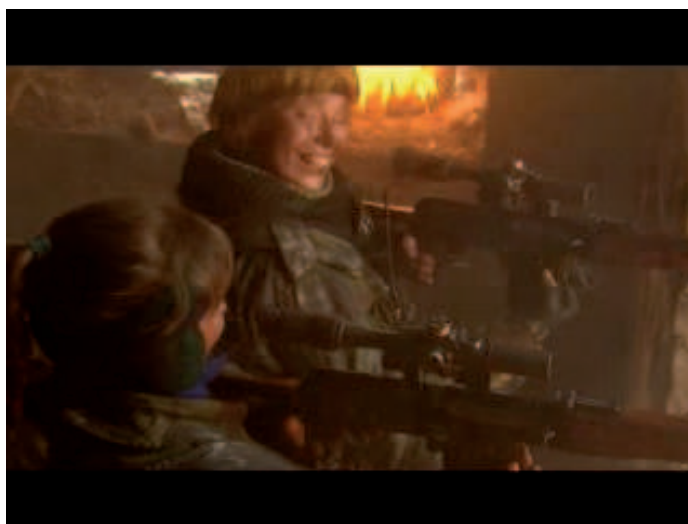
Illustration 4 – Les femmes snipers dans Chistilishche de Nevzorov, 1997

D'autres films reprennent cette figure de la sniper balte, comme la série télévisée Moujskaïa rabota (Un travail d'homme, 2001) de Tigran Keosaïan, dans laquelle deux jeunes femmes originaires des pays baltes sont recrutées pour mener une attaque contre un convoi de l'OSCE (Organisation pour la sécurité et la coopération en Europe). Proryv (La percée, 2006) de Vitali Loukine, qui prétend s'inspirer de faits réels met en scène une tireuse d'élite blonde qui combat contre les Russes sous le commandement d'un mercenaire islamiste (Illustration 5).