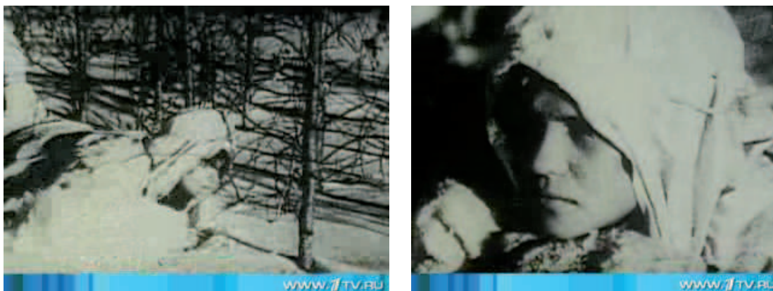
Illustration 1 – Une femme sniper soviétique durant la seconde guerre mondiale, en tenue blanche de camouflage

Extrait du reportage : http://www.1tv.ru/news/social/24520