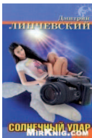
Illustration 2 Couverture du livre Coup de soleil de Linchevski, Novosibirsk, Mangazeia, 2008