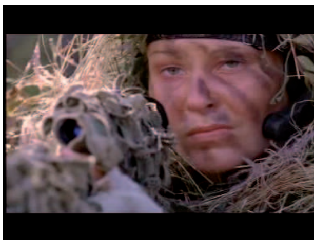
Illustration 5 – La femme sniper dans Proryv de Loukine, 2006

D'autres films reprennent cette figure de la sniper balte, comme la série télévisée Moujskaïa rabota (Un travail d'homme, 2001) de Tigran Keosaïan, dans laquelle deux jeunes femmes originaires des pays baltes sont recrutées pour mener une attaque contre un convoi de l'OSCE (Organisation pour la sécurité et la coopération en Europe). Proryv (La percée, 2006) de Vitali Loukine, qui prétend s'inspirer de faits réels met en scène une tireuse d'élite blonde qui combat contre les Russes sous le commandement d'un mercenaire islamiste (Illustration 5).