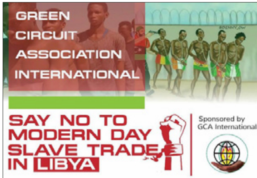
Captures d'écran des visuels produits par la Green Circuit Association, la zone NBM de Cape Town et le Norsemen Club sur les réseaux sociaux en 2017 et 2018

Cette dimension politique joue un rôle d'autant plus important que c'est au nom de cette aspiration collective que peuvent se justifier certaines pratiques. Nombre de « chapitres » se sont mobilisés contre l'exploitation d'hommes et de femmes nigériens au moment des publications d'enquêtes d'Al-Jazeera sur des marchés aux esclaves de Libye en 2017. Au début de la pandémie de Covid-19 en Europe, en mars 2020, la Green Circuit Association de Chypre, l'association des Maphites, a fourni des vivres à ses membres, tandis que les Supreme Vikings de Malaisie organisaient des distributions similaires. Ces activités sont largement mises en avant par les confraternités, et abondamment relayées sur les pages de leurs réseaux sociaux ou de leurs antennes locales.