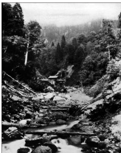
« Paysage frontalier adjar ». W. Rickmer Rickmers, « Lazistan and Ajaristan », The Geographical Journal , Vol. 84, N° 6 (Déc. 1934), p. 469. © W. Rickmer Rickmers.

sion de nouer des relations avec la population civile locale, fondées sur la protection des biens et des personnes 30 . Cette occasion est précieuse pour des gardes-frontières largement isolés de la population locale. Issus en presque totalité des régions slaves de l'URSS, ils ne maîtrisent que peu les langues et coutumes locales 31 . Cet isolement est illustré très directement par les dossiers conservés dans les archives géorgiennes, qui révèlent un recours systématique à des traducteurs depuis le turc et le géorgien 32 . Les gardes-frontières, dans leur travail auprès de la population locale, sont ainsi appelés par les autorités du Parti à montrer la communauté d'intérêts entre l'État et les citoyens de la zone-frontière 33 . Les affaires de violence commises par les bandes contre des individus sont mises en avant par les fonctionnaires soviétiques. Dans l'affaire de la bande de Kasim Kaya, le viol et le meurtre de la fille d'un paysan de la région d'Akhalsikhe, Suleyman Yusuf Oğlu, figurent en tête des chefs d'accusa-