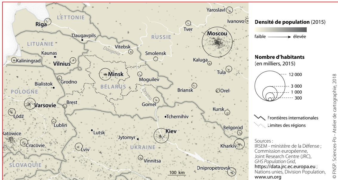
Figure 1 Le Bélarus dans son environnement régional

de septembre 2016 se tiendraient elles aussi dans le calme. Pour Loukachenka, c'est le signe que le pragmatisme prime désormais à Bruxelles, ce qui ouvre la voie au dialogue « constructif » qu'il réclame depuis longtemps : une relation fondée sur des intérêts partagés et non sur des valeurs démocratiques prétendument communes.