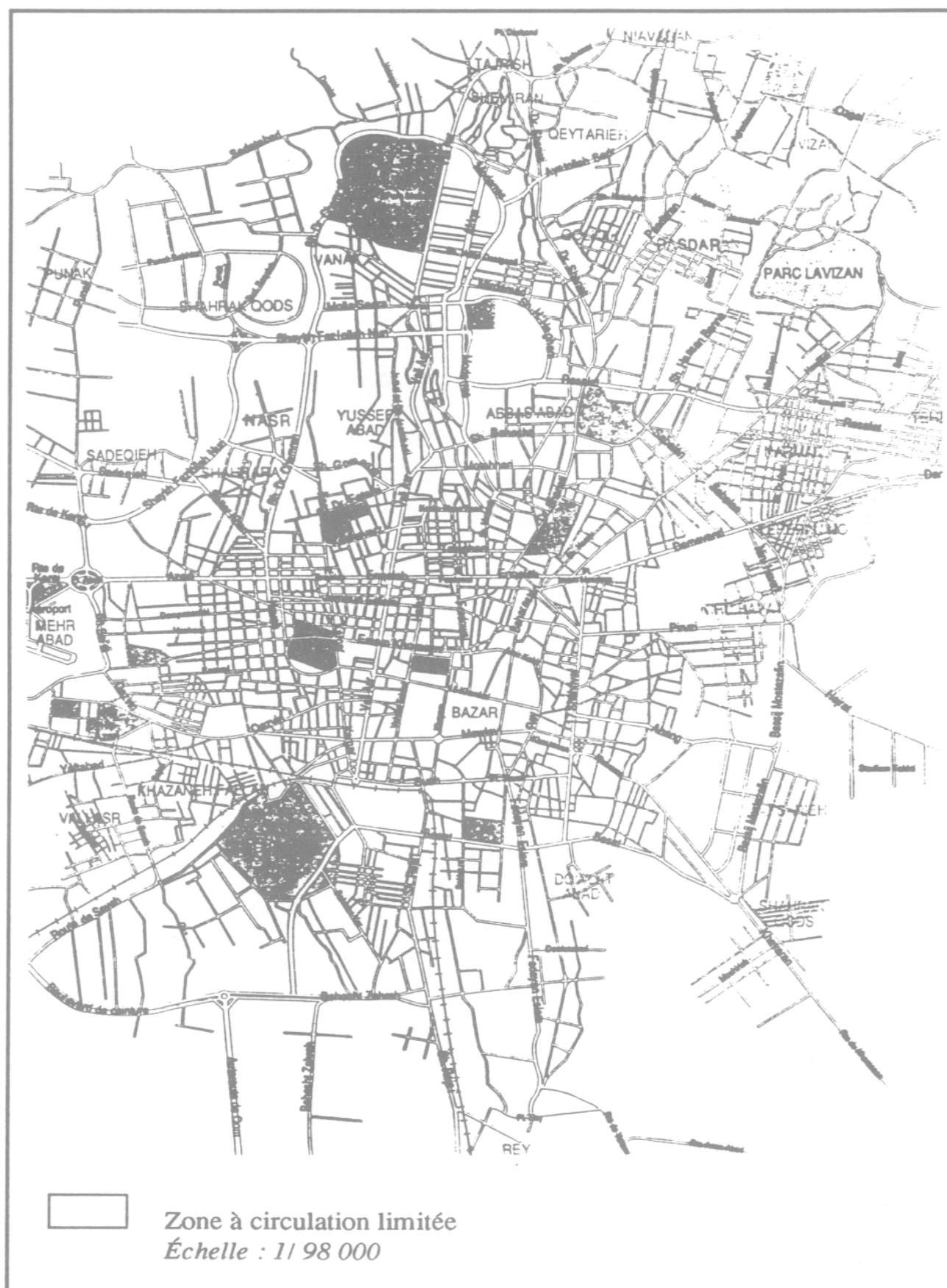
Téhéran (Espace bâti en 1989)