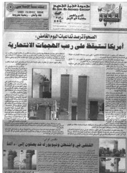
Première page d'al-Sahwa (journal d'al-Islâh daté du 13 septembre 2001 : L'Amérique se réveille effrayé par les attaques suicides

27 Ce bref détour par les fondements idéologiques des Frères musulmans, indique que la plasticité dont nous avons tenté de montrer les expressions dans la conjoncture de l'après-11 septembre 2001, pourrait autant être le fruit d'un héritage assumé que le résultat des spécificités politiques du Yémen contemporain. Ainsi, saisir les pratiques politiques d'Islâh implique de dépasser l'étude de ses propres particularités, déjà largement analysées, afin d'inscrire ce parti dans la cohérence idéologique de l'islamisme réformateur prôné par l'Organisation des Frères musulmans qui, seule, permet de comprendre ce qui conduit les membres yéménites des Frères musulmans à rester affiliés à un parti (al- Islâh) dans lequel ils ne sont qu'une tendance parmi d'autres.