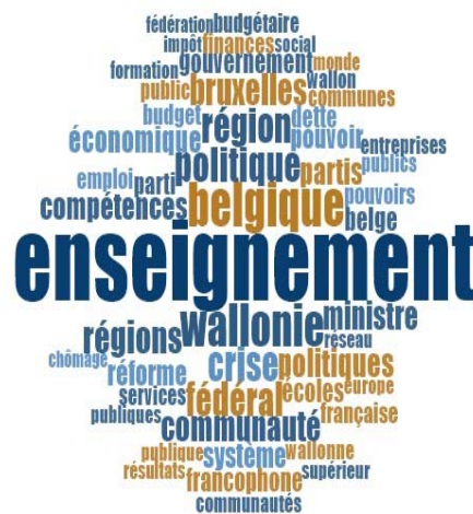
Figure 4 : Résultats de l'analyse NVivo pour le panel de la Wallonie

Dans le cas de la Wallonie, le nuage de mots fait de façon tout à fait unique ressortir davantage de références à l'Etat central (Belgique) qu'à la région. Cette spécificité renvoie à la structure particulière du fédéralisme belge: ainsi, la pertinence de l'éducation comme politique publique dans le discours des acteurs reflète la nature de l'organisation des autorités publiques dans la partie francophone de la Belgique, où la Fédération de Wallonie Bruxelles est responsable du secteur de l'éducation, tandis que la région wallonne est responsable des