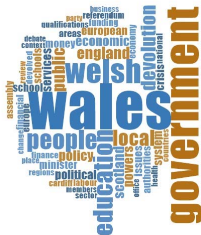
Figure 3: Résultats de l'analyse NVivo pour le panel du pays de Galles

Le nuage de mots associé à la Bretagne fait ressortir l'importance quasi équivalente entre la « région » et la « Bretagne », ce qui témoigne d'une forte identité régionale ressentie par les acteurs. Le terme étant en effet évoqué plus régulièrement que la « nation ». L'analyse souligne aussi l'importance de la crise économique (crise, euro). Le rôle des entreprises comme acteurs importants du développement économique ressort également notablement. Par ailleurs, le nuage de mots reflète des dynamiques propres à chaque secteur d'action publique, en particulier « recherche, éducation, emploi ». En revanche, contrairement aux autres régions étudiées, les « partis » ne ressortent pas dans l'analyse. En somme, en raison de la forte identité régionale ressentie, les enquêtés se font une opinion plutôt robuste et influente du modèle territorial breton.