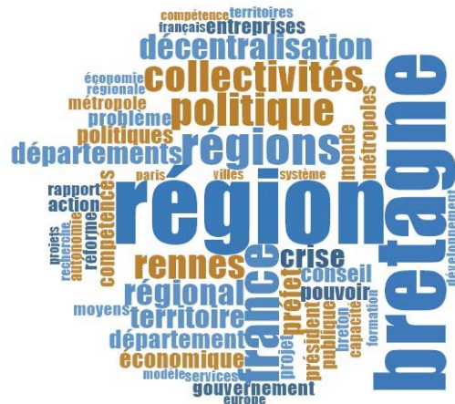
Figure 2: Résultats de l'analyse NVivo pour le panel de la Bretagne

Le nuage de mots associé à la Bretagne fait ressortir l'importance quasi équivalente entre la « région » et la « Bretagne », ce qui témoigne d'une forte identité régionale ressentie par les acteurs. Le terme étant en effet évoqué plus régulièrement que la « nation ». L'analyse souligne aussi l'importance de la crise économique (crise, euro). Le rôle des entreprises comme acteurs importants du développement économique ressort également notablement. Par ailleurs, le nuage de mots reflète des dynamiques propres à chaque secteur d'action publique, en particulier « recherche, éducation, emploi ». En revanche, contrairement aux autres régions étudiées, les « partis » ne ressortent pas dans l'analyse. En somme, en raison de la forte identité régionale ressentie, les enquêtés se font une opinion plutôt robuste et influente du modèle territorial breton.