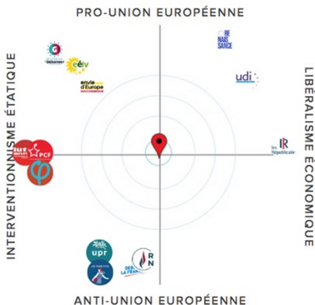
L'espace politique bidimensionnel de « La Boussole européenne » 2019.

Les utilisateurs de « La Boussole européenne » (environ 60 000 depuis la mise en ligne lundi 13 mai) sont ainsi positionnés dans l'espace politique français en fonction de leurs réponses et peuvent comparer leur positionnement à celui des principales listes, l'emplacement de ces dernières étant établi à partir d'une analyse des programmes de campagne (l'ensemble du travail d'analyse des programmes de campagne est disponible sur le site Internet).