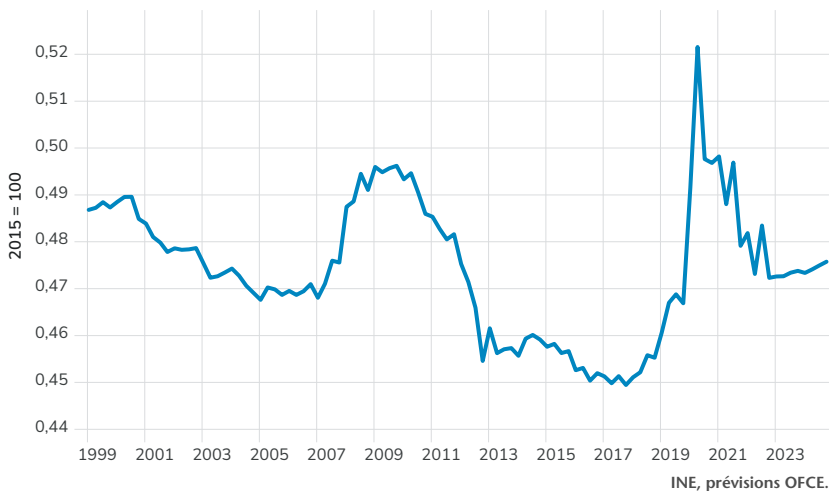
Graphique 3. Part de la masse salariale dans la valeur ajoutée

Côté commerce extérieur, de légers gains de parts de marché sont attendus du fait d'un niveau des prix un peu plus bas que dans les autres pays. La croissance du tourisme international en revanche qui avait soutenu les recettes d'exportations ne devrait plus jouer en 2024.