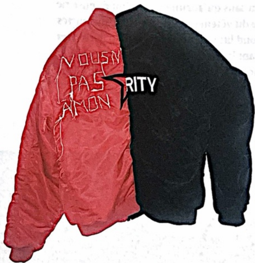
5a-b. Vava Dudu, (a) Sans titre (secu) , (b) Sans titre (rity) , 2017, broderie sur tissu, 68 x 140 x 4 cm chacune, Paris, Lafayette Anticipations – Fonds de dotation famille Moulin.

qui déjouent la surveillance et performent la solidarité, plutôt que la hiérarchie des rapports humains.