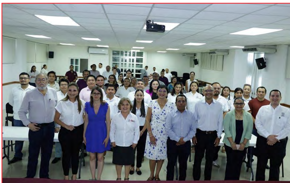
Figure 4 Réunion avec la procureure spéciale de la lutte contre la corruption du Quintana Roo

Ministère public de la lutte contre la corruption, Chetumal, août 2023. Réunion en présence du président du tribunal administratif de l'Etat de Quintana Roo, du président de la cour des comptes locale, de la contrôlease, de la procureure, de la présidente de l'Institut d'accès à l'information et de protection des données personnelles et du personnel du bureau de Chetumal.