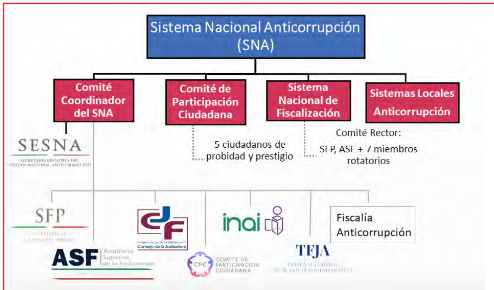
Figure 2 Le Système national anticorruption mexicain

Source : Gouvernement du Mexique, www.gob.mx/sesna/es/articulos/el-sistema-nacional-anticorrupcion?idiom=es