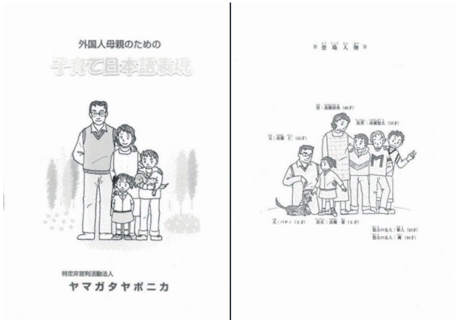
FIGURE 02. ICONOGRAPHIE DU MANUEL « LE JAPONAIS POUR ÉLEVER SON ENFANT, À DESTINATION DES MÈRES ÉTRANGÈRES » (GAIKOKUJIN HAHAOYA NO TAME NO KOSODATE NIHONGO HYŌGEN 外国人母親のための子育て日本語表現)