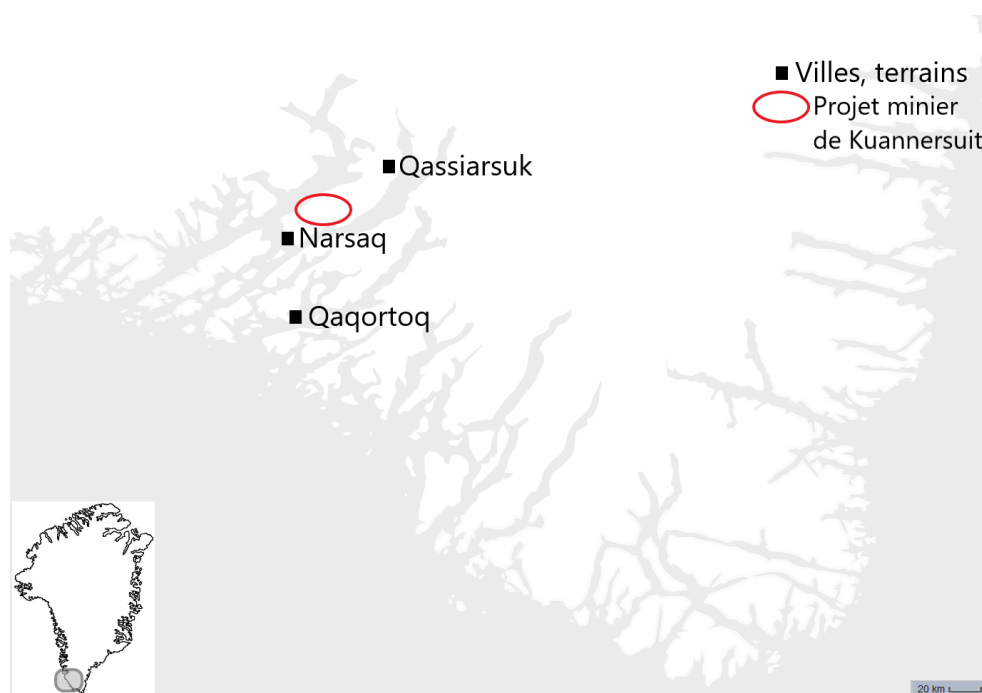
Figure 1 : Région sud-groenlandaise