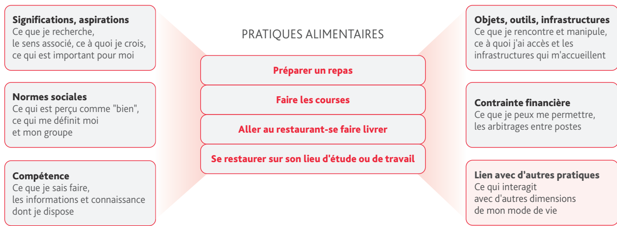
FIGURE 2. L'alimentation peut être décomposée en quatre pratiques concrètes, représentées via six composantes

L'alimentation est un ensemble de pratiques concrètes, attachées à des individus ou ménages, partagées au sein de groupes. Une pratique combine plusieurs éléments en interactions: c'est un ensemble d'aspirations, de capacité et de contraintes. C'est d'ailleurs pour cela qu'elle ne change pas si facilement.