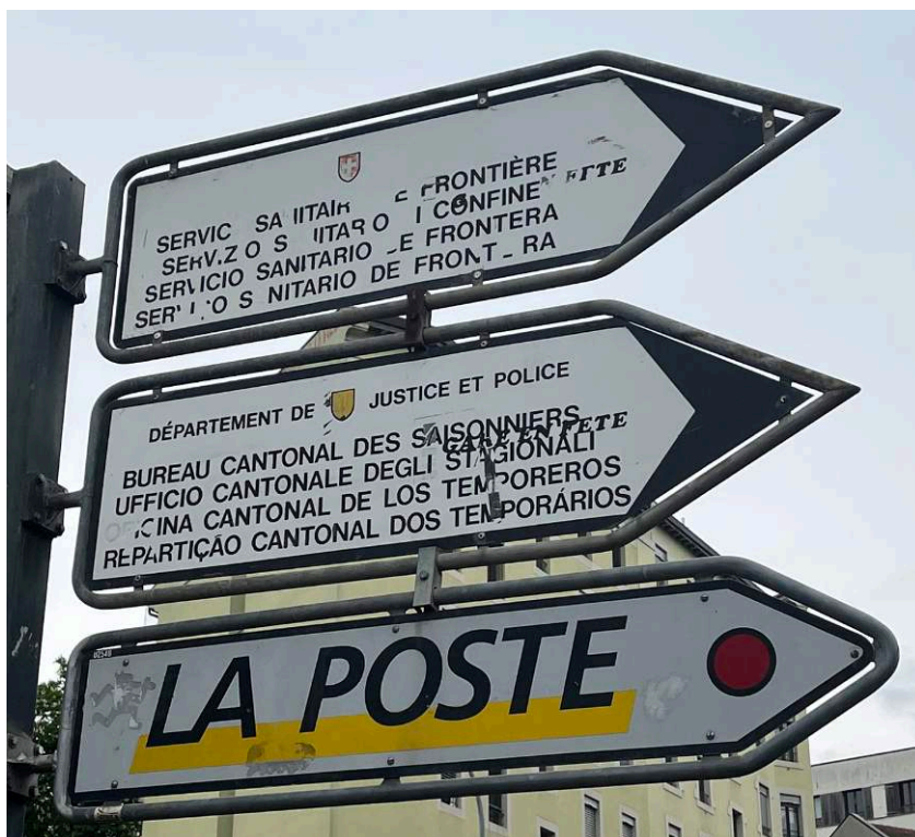
Ill. 1: Gare de Cornavin, Genève, 2023. L'un des derniers vestiges du contrôle sanitaire dans l'espace public suisse.

migratoire suisse de l'après-guerre était le plus restrictif d'Europe de l'Ouest en matière d'établissement et d'intégration des étranger-ère-s (Hammar 1985, Ellermann 2013). Le statut de saisonnier-ère helvétique traduisait cette orientation: le cumul et la longévité des structures coercitives qui le composaient en faisaient une construction juridique unique parmi les pays d'immigration européens. En plus du contrôle sanitaire de rigueur à chaque début de saison, les saisonnier-ère-s ne pouvaient pas changer d'emploi, de secteur ou de canton; ils et elles avaient l'interdiction de faire venir leurs familles, de signer un bail à loyer à leur nom ou de s'engager dans toute activité jugée politique; ils et elles avaient, en outre, l'obligation de quitter le pays durant les «ruptures saisonnières» sans garantie de retour la saison suivante (décision de l'employeur-euse); ils et elles étaient, enfin, discriminé-e-s en matière d'impôt et de sécurité sociale