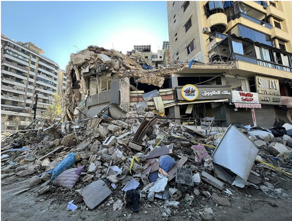
Figure 3. Une rue commerçante de Haret Hreik (banlieue sud de Beyrouth)

Dans les décombres de cet immeuble, on peut voir des objets, notamment de la literie, mêlés aux gravats. On peut noter aussi l'effet très différencié des bombardements, démolissant totalement certains immeubles tandis que leurs voisins restent debout tout en étant endommagés par le souffle des explosions.