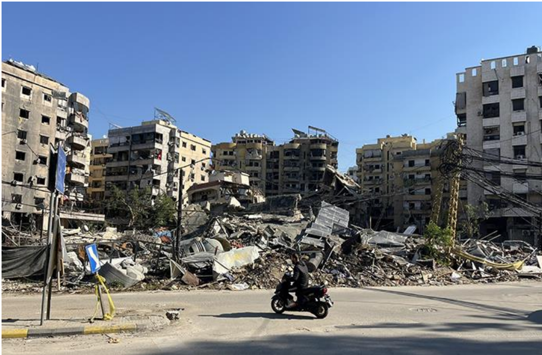
Figure 4. Haret Hreik, banlieue sud de Beyrouth

La vie reprend timidement son cours devant des immeubles détruits par l'aviation israélienne à Haret Hreik, dans la banlieue sud de Beyrouth. On distingue bien les panneaux solaires démantelés et d'autres encore en place sur les immeubles non touchés.