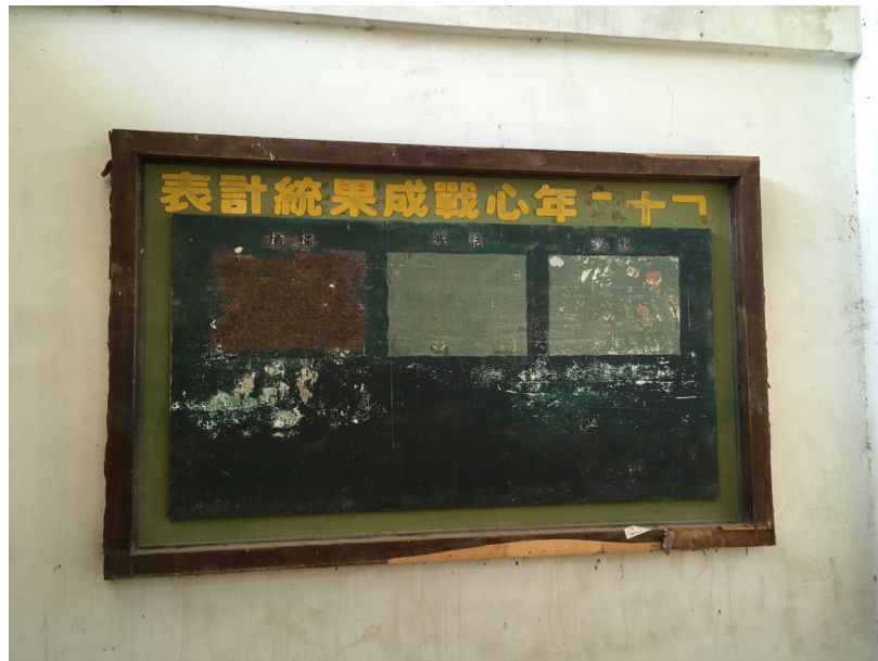
Figure 6. « Tableau statistique des accomplissements de la guerre psychologique par année » (titre incomplet)