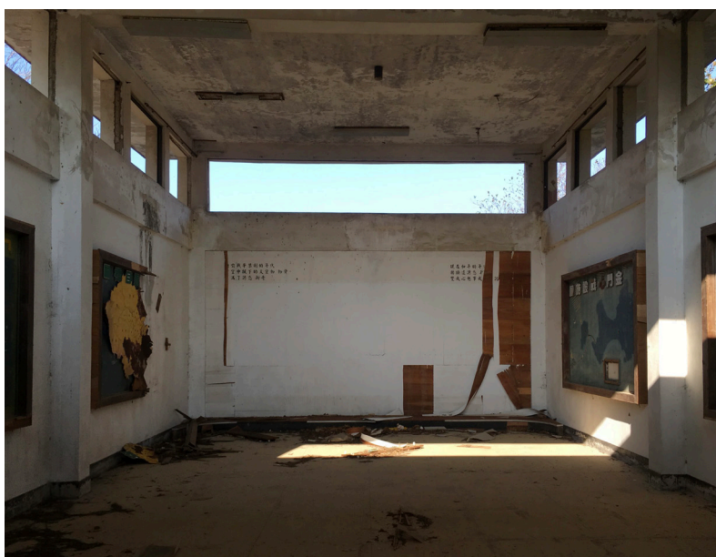
Figure 3. Pièce principale

N'ayant d'autre choix que celui auquel ma témérité et ma force physique m'astreignent, je m'engage dans l'un des deux chemins déjà ouverts. Je me retrouve alors dans une pièce d'un volume immense, où la lumière du matin s'engouffre à travers une rangée d'ouvertures percées au ras du plafond (figure 3).