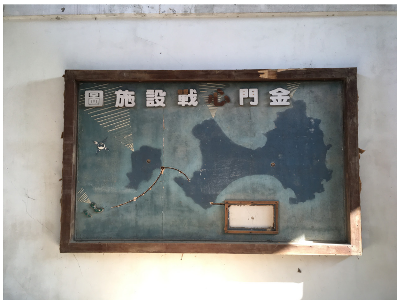
Figure 5. « Carte des infrastructures de la guerre psychologique à Kinmen »

Les quatre îles principales de l'archipel de Kinmen y sont représentées, mais seules les deux plus petites, celles de Dadan 大膽 (0,79 km 2 ) et d'Erda 二膽 (0,28 km 2 ), à l'ouest, ont conservé l'empiecement en relief permettant de les faire figurer. Les contours des îles de Kinmen (134,25 km 2 ) et de Lieyu 列嶼 (14,85 km 2 ), dite également Little Kinmen ( Xiao Jinmen , 小金門), ne se devinent donc qu'au différentiel de couleur provoqué par une exposition plus ou moins longue à la lumière du jour. Si la légende a disparu ici également, ma connaissance du terrain et des normes cartographiques me permettent de comprendre les traces d'éléments restants. Les traits courbés, tranchés dans le bois de la mer, représentent les liaisons maritimes. Elles s'étirent du port de Shuitou 水頭 (Kinmen) à celui de Jiugong 九宮 (Little Kinmen), lui-même relié à celui de Dadan. La succession de traits blancs horizontaux qui s'allongent à mesure qu'ils s'éloignent de Kinmen donnent à voir la localisation et la portée des haut-parleurs tournés vers le continent. Les petits cercles excavés, quant à eux, indiquent les stations de radiodiffusion, dans la mesure où ils se trouvent sur les points culminants des îles de Kinmen (253 mètres pour le mont Taiwu 太武) et de Little Kinmen (119 mètres pour le mont Qilin 麒麟).