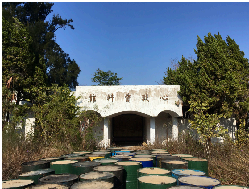
Figure 1. Le Centre de documentation sur la guerre psychologique

C'est un bâtiment qu'aucune carte n'indique. Derrière les barils qui gardent mal son entrée, sur son fronton blanc à la peinture écaillée, son nom s'inscrit en grands caractères dont l'or ne brille plus : « Centre de documentation sur la guerre psychologique » ( xinzhan ziliaoguan , 心戰資料館) (figure 1). Il m'aura fallu attendre le quatrième mois de mon enquête de terrain à Kinmen ( Jinmen , 金門), petit archipel sous la juridiction de Taipei bien que situé à quelques encablures du continent chinois, pour qu'un coup d'œil furtif lors d'un trajet à bicyclette ne m'incite à franchir un portail discrètement entrouvert et ne me conduise au pied de cet édifice à l'abandon, en bordure de la ville de Shanwai 山外, le matin du 17 janvier 2018 1 . Après une courte hésitation, je déploie la béquille de mon vélo et pénètre dans le bâtiment, smartphone à la main. De cette « violation de propriété récréative 2 », j'espère alors