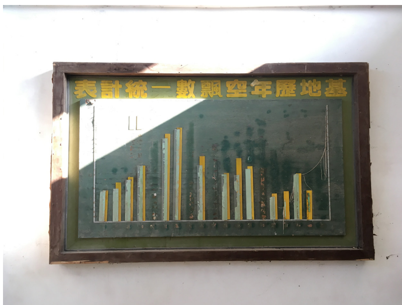
Figure 4. « Graphique représentant le nombre annuel de ballons aériens lancés depuis la base » (© Alexandre Gandil, 2018)

magistrature suprême de la République de Chine (Taiwan), son double mandat (2008-2016) ayant marqué une période de rapprochement sans précédent entre les deux rives du détroit. Sur les côtés de la pièce, les activités de la guerre psychologique menées depuis Kinmen se retrouvent objectivées par leur mise en données, statistique ou cartographique, et matérialisées par les panneaux de bois. Sur le mur de droite, un premier panneau fait ainsi figurer un histogramme dont le titre se lit presque sans difficulté : « Graphique représentant le nombre annuel de ballons aériens lancés depuis la base » ( jidi linian kongpiao shuliang tongji , 基地歷年空飄數量統計表) (figure 4).