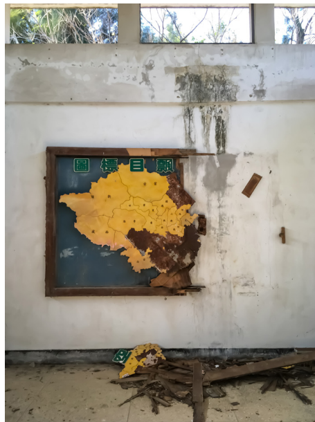
Figure 7. « Carte des objectifs visés par les ballons aériens » (© Alexandre Gandil, 2018)

Il s'agit du plus dégradé des quatre, puisqu'un bon tiers s'est vraisemblablement effondré en raison d'une infiltration d'eau. Mais l'œil averti parvient à reconstruire la carte de la République de Chine dans ses frontières revendiquées (figure 7bis), c'est-à-dire dont le territoire,