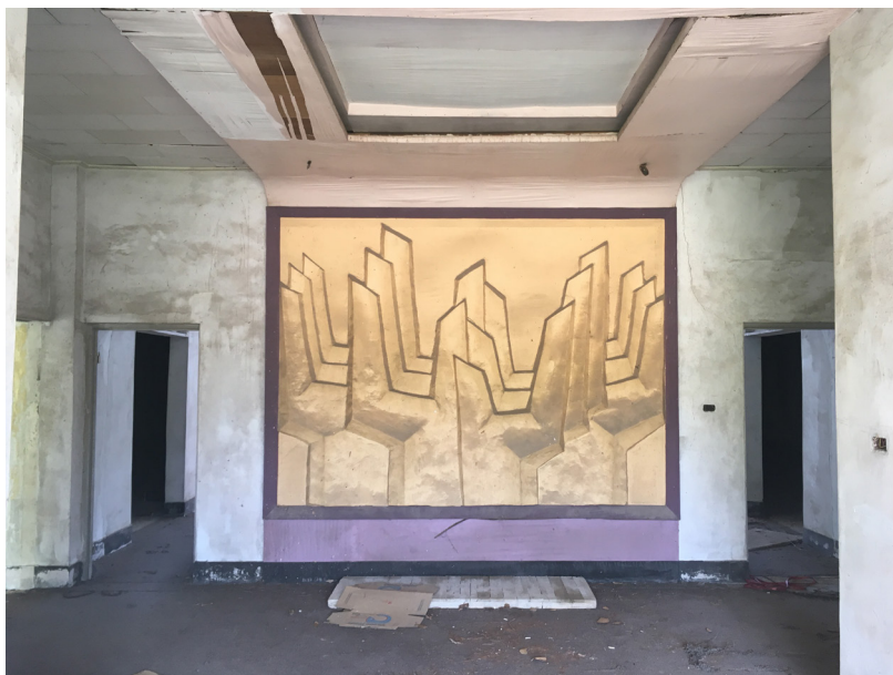
Figure 2. Le préau du Centre de documentation sur la guerre psychologique

Urbexer malgré lui, le jeune doctorant que je suis au début de l'année 2018 n'a pas conscience de cette généalogie, ni des glissements qu'il pourra peut-être y introduire. Après avoir contourné les barils et repoussé les branches qui bloquaient mon chemin, je m'enfonce sous un petit préau rectangulaire, plus large que long, où se trouvent quatre portes (figure 2).