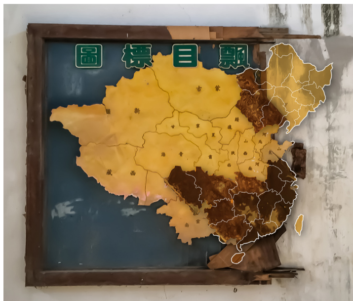
Figure 7bis. Reconstitution par la pensée de la « Carte des objectifs visés par les ballons aériens » (© Alexandre Gandil, 2018)

par-delà le continent contrôlé par Pékin, englobe également la Mongolie extérieure et mord de petites parties de la Russie, du Tadjikistan, de l'Afghanistan, du Pakistan, du Népal, de l'Inde et du Myanmar (Birmanie).