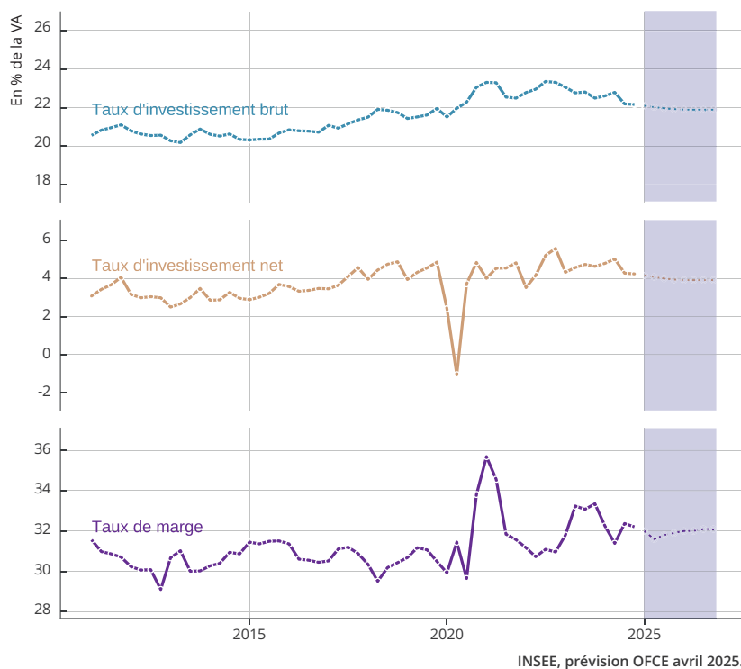
Graphique 4.1. Taux d'investissement et taux de marge des SNF

marge des SNF fin 2024 demeurant plus d'un point au-dessus de son niveau d'avant la crise sanitaire. Toutefois, cette bonne tenue des marges masque une importante hétérogénéité entre branches d'activité. Elle est essentiellement portée par la branche de l'énergie (graphique 4.2), bénéficiant de la hausse des prix de ses produits. Les marges se sont également améliorées dans les services depuis fin 2019, en particulier les services de transport et aux entreprises. Selon nos prévisions, le taux de marge se replierait début 2025, atteignant 31,6 % de la valeur ajoutée au deuxième trimestre, sous l'effet d'une hausse de la fiscalité sur les entreprises. Il se redresserait ensuite, porté par des gains de productivité supérieurs à la hausse du salaire réel en 2026.