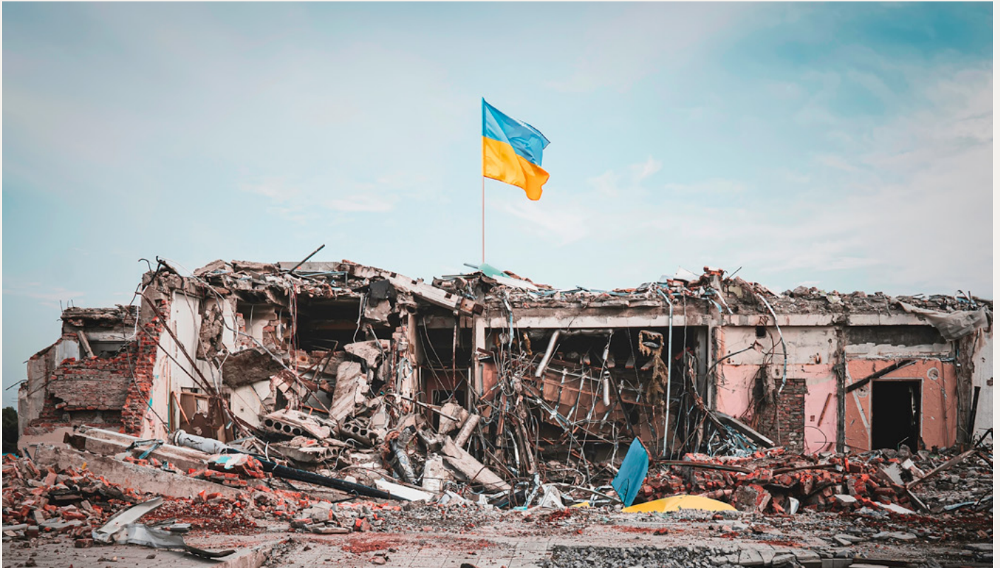
Destruction d'une base militaire ukrainienne par des frappes aériennes et des tirs d'obus russes.

nécessité pour stabiliser l'Ukraine. Sans ce soutien, cette dernière ferait face à une profonde crise économique et de légitimité, avec tous les effets secondaires potentiels. À ce titre, l'aide à la reconstruction sert autant les intérêts des pays donateurs que ceux de l'Ukraine, à l'image de ce que fut le plan Marshall pour les États-Unis et l'Europe après la Seconde Guerre mondiale.