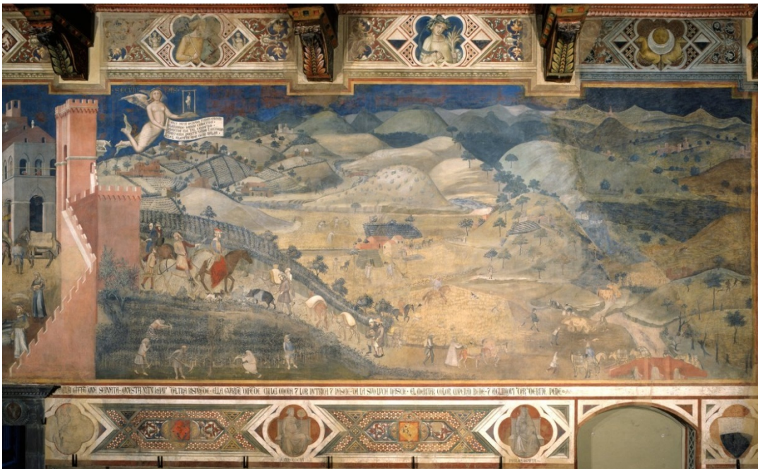
Ambrogio Lorenzetti, Les effets du bon gouvernement à la campagne, 1388-40

Dans la seconde représentation, de 1338, proposée par l'artiste, « l'Allégorie du bon et du mauvais gouvernement », la ville dépeinte par Lorenzetti est à la fois le théâtre des coopérations humaines (figurées par des processions et des rondes) mais elle est de plus ouverte sur la campagne, ses animaux et ses écosystèmes.