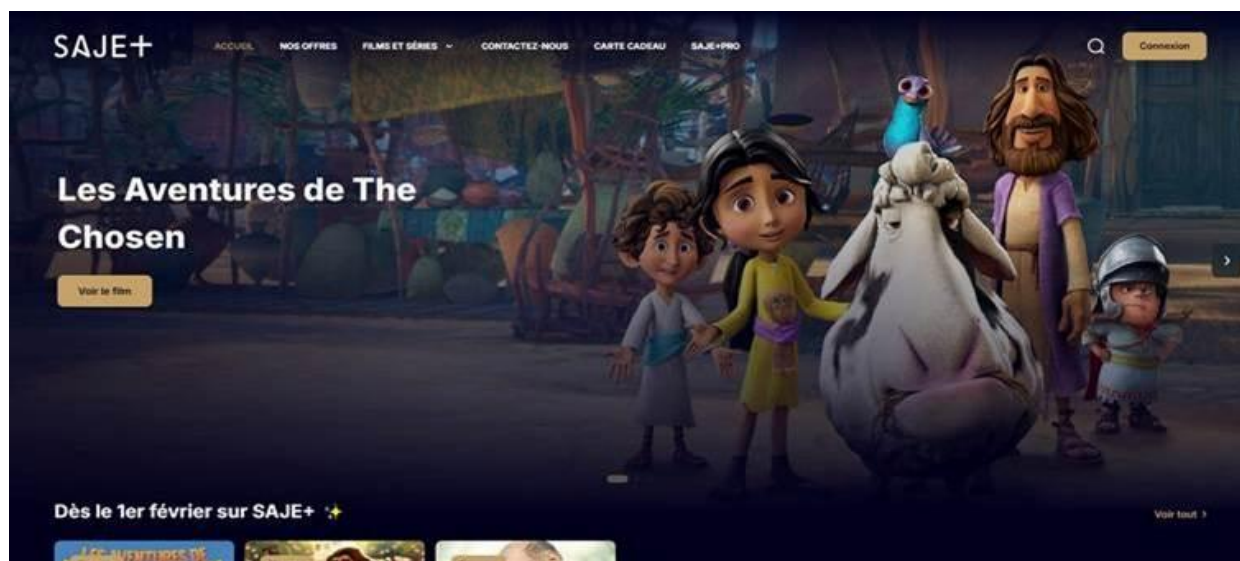
Figure 2 : Haut de la page d'accueil de SAJE+ avec menu défilant au 14 janvier 2026