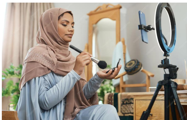
Figure 3 : Image d'une influenceuse portant le hijab qui réalise un tutoriel de maquillage en face de son téléphone tenu par un rigging professionnel