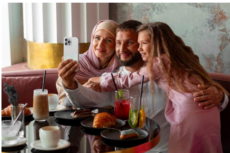
Figure 3 : Image d'une famille se prenant en photo pendant l'iftar

Ces variations temporelles s'accompagnent de formes d'expression elles-mêmes fluctuantes. L'interpréter comme le résultat d'une stratégie maîtrisée revient à lui prêter une cohérence qu'elle n'a pas. Les usages ordinaires – notamment ceux de femmes musulmanes – illustrent bien ces fluctuations : la présence religieuse en ligne se manifeste autant dans des gestes du quotidien comme la préparation de repas pour l' iftar – illustrée en figure 3, qui montre un moment de rupture du jeûne –, le partage de moments familiaux ou des conseils liés au jeûne, que dans des récits professionnels où certaines créatrices de contenu évoquent leur activité entrepreneuriale, leur parcours d'études ou leur expérience de travail tout en apparaissant avec le hijab. Ces formes discrètes de prise de parole contribuent à modifier, de manière progressive, la manière dont la visibilité religieuse est perçue. Elles font émerger des modes de présence plus diffus, moins frontaux, qui échappent en partie aux catégories habituelles de lecture.