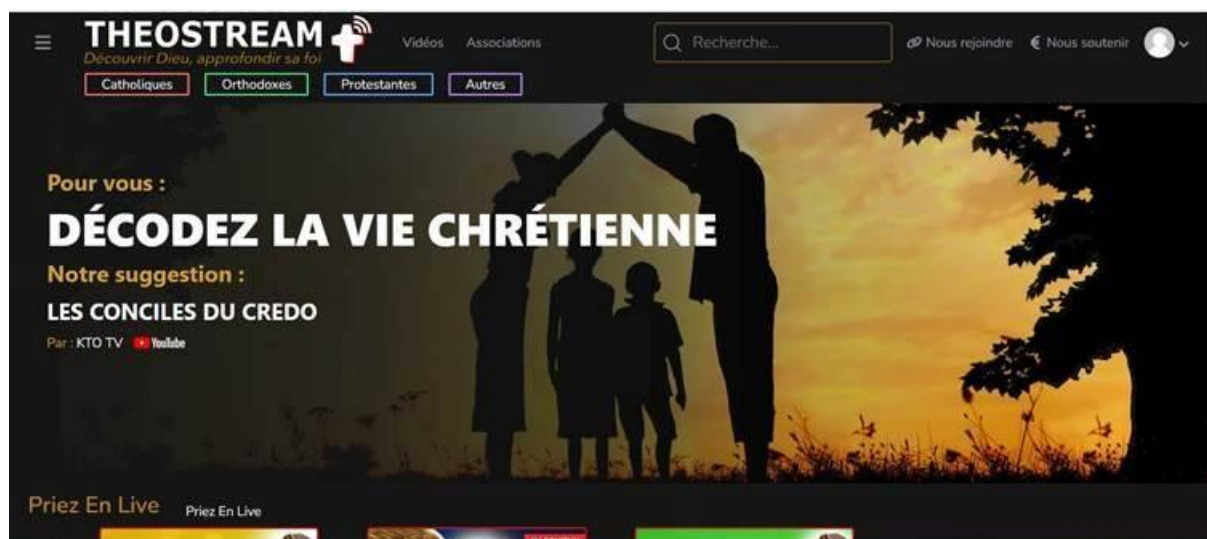
Figure 1 : Haut de la page d'accueil de Theostream avec menu défilant au 1er janvier 2026

D'autant qu'en 2020, le lancement de « LeFilmChrétien », plateforme de vidéo à la demande par abonnement, correspondait davantage au modèle d'un « Netflix chrétien