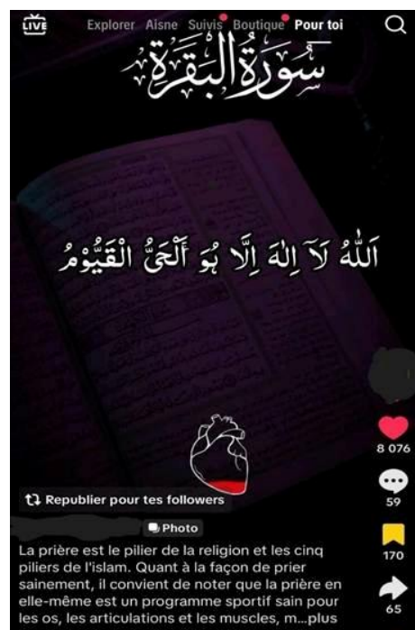
Figure 2 : Exemple de contenu religieux circulant sur TikTok : citation coranique et rappel sur la prière

Un exemple de contenu circulant sur TikTok illustre ces formats de rappel religieux (cf. figure 2). La vidéo montre un Coran ouvert accompagné d'une référence à la sourate numéro 2 du Coran Al-Baqara (i.e. La vache) et affiche un extrait du verset connu sous le nom d' Ayat al-Kursi . L'image est associée à une mise en scène visuelle simple – notamment un symbole de cœur – destinée à renforcer la dimension émotionnelle du message. Les indicateurs d'engagement observables (plus de 8 000 mentions « j'aime », une soixantaine de commentaires et plus de 150 sauvegardes) témoignent de la circulation de ces micro-contenus religieux sur les plateformes.